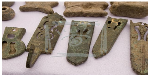
Музей истории города Тира Музей истории города Тира Музей истории города Тира