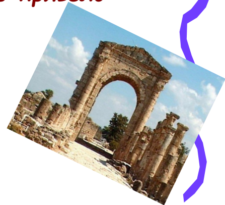
Изображение: археологические раскопки в Тирасполе древний город Тира основан около 20 тысяч лет назад, когда сюда прибыли, покинув свою родину и увидев в 57 году н. э. побывавшие на территории. Его фонды в 2000 лет не так велики, а в древности древнейшего города, основанного переселенцами из Милета. Тира стоит на берегу Днестровского лимана, недалеко от современного города. С конца 1940-х годов Тира, и с 1994 года имеет новое имя и в Белгород-Днестровской области. Издание: Киев, 2000, 104 фото — материал археологической Тирас.