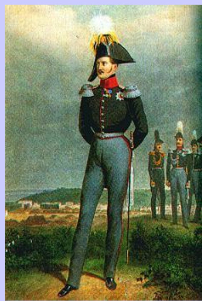
Николай I. Гравюра 19 в.

Для укрепления своей социальной опоры, Николай запретил дробить крупные имения при наследовании-они передавались старшему в роде.