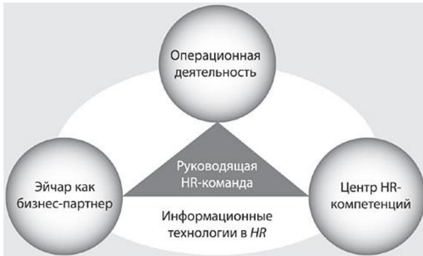
Рис. 1. НОВАЯ HR-МОДЕЛЬ В КОМПАНИИ SAP