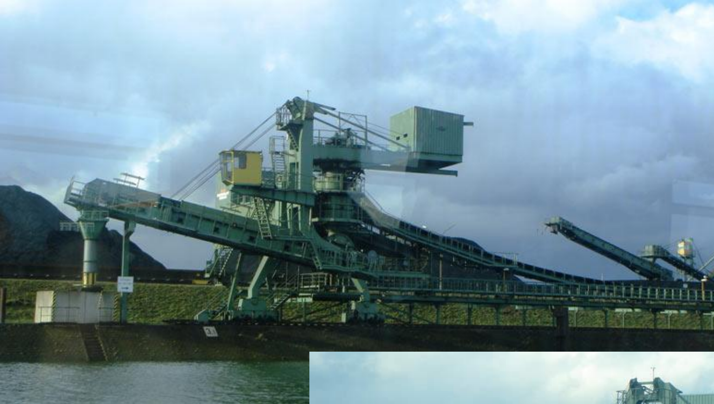
Участок по перегрузке угля