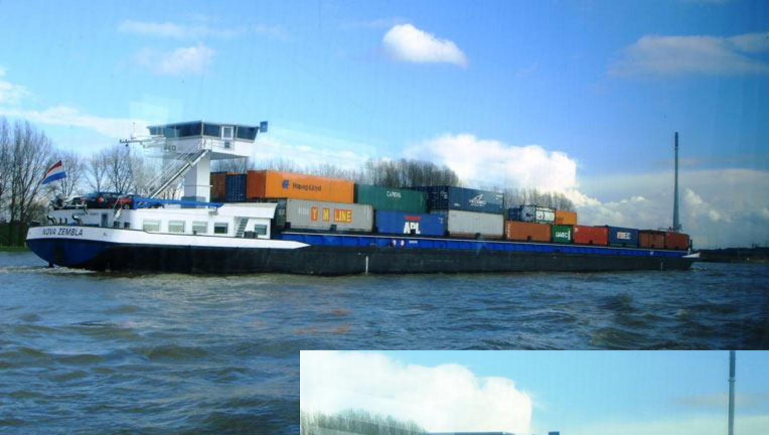
Контейнерные перевозки по Рейну