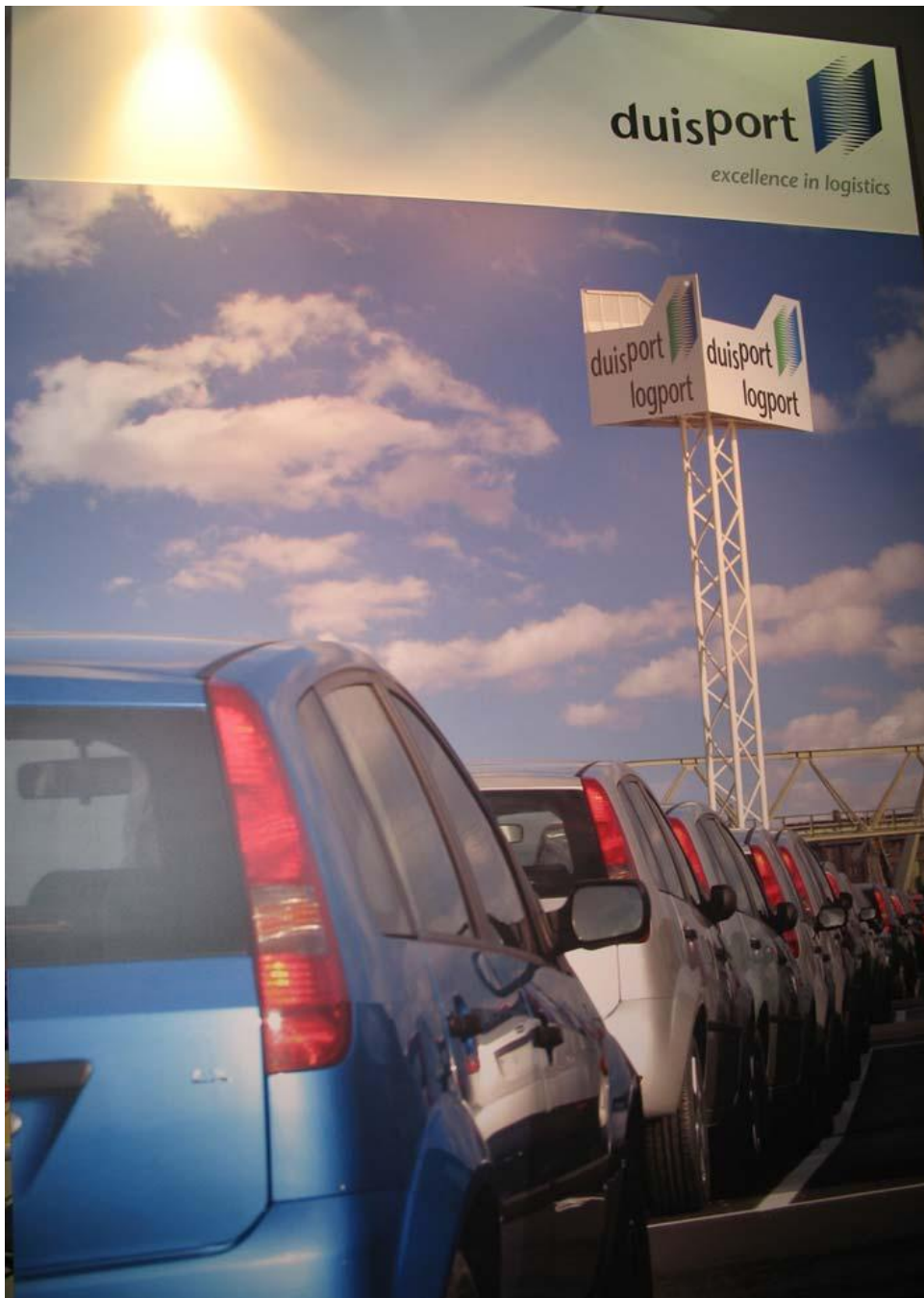
Автомобильная логистика в порту города Дуйсбурга