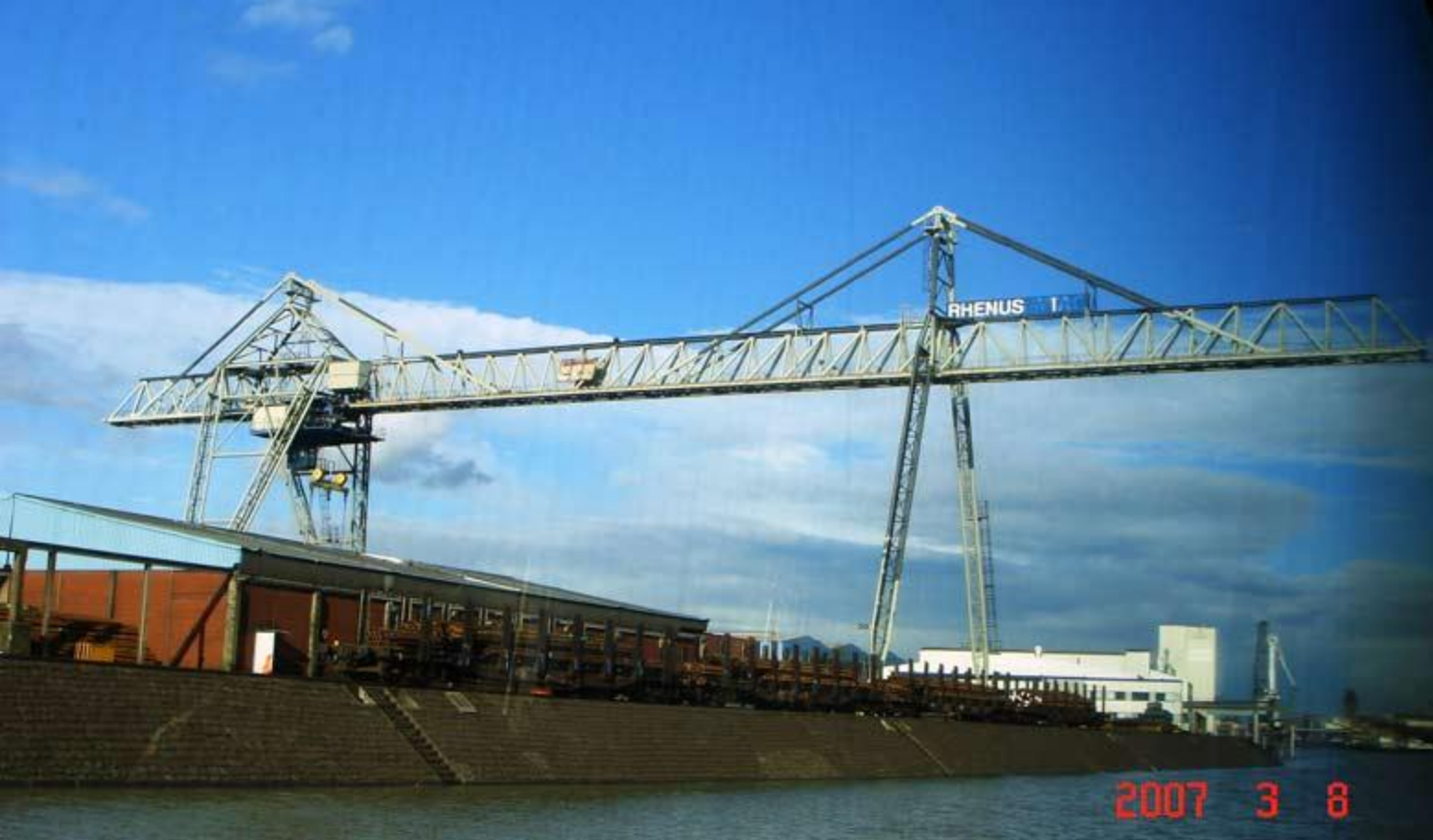
Значительный вылет козлового крана