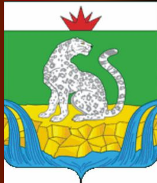
Герб Шушенского района

Средь гор в заснеженном уборе Живёт могучий властелин, Открыты все ему просторы, Он этих мест здесь господин. Как имя «Ирбис» величаво Его торжественно звучит. И мы использовали право, Назваться так, немедленно решив. «Ирбис» шлёт привет сердечный Из посёлка с Шушкой-речкой. Ленин в ссылке здесь бывал, Да красоты повидал: Где шумит зелёный бор – То деревьев разговор. Накоплен опыт дедов и отцов – В июле тут звенит «Саянское Кольцо». Здесь царят тепло, уют, Люди добрые живут.