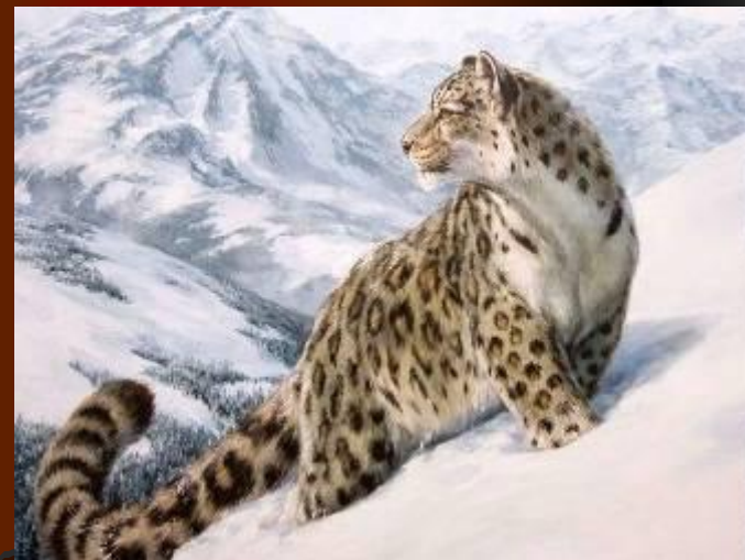
Ирбис – снежный барс