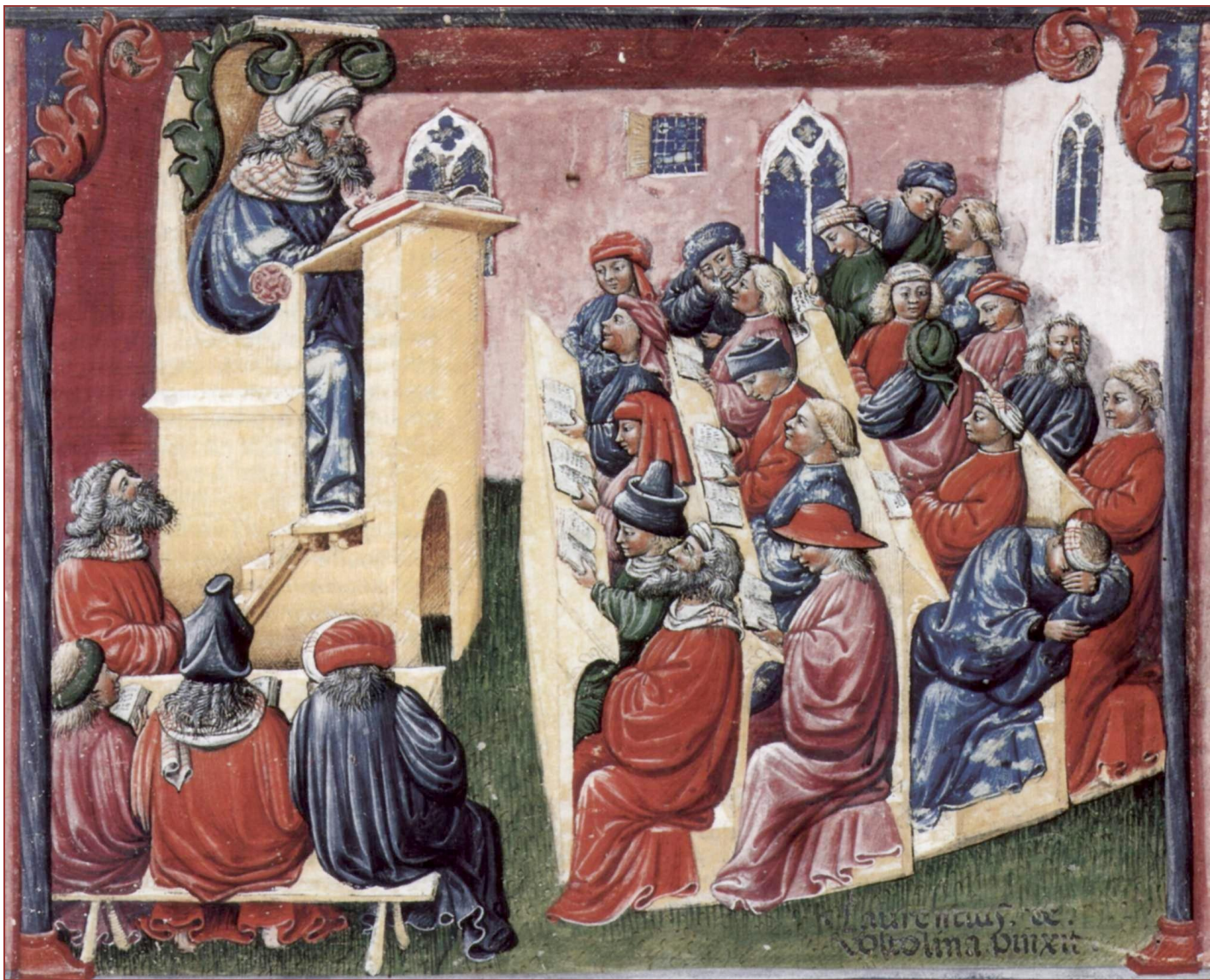
Аудитория западноевропейского университета в 1350-х гг.