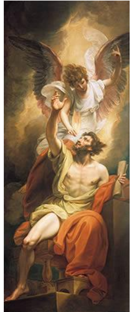
Бенджамин Уэст. Исайя (1782)

Великие пророки: Исайя, Иеремия, Даниил, Иезекииль