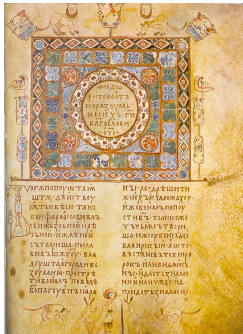
Страницы из «Изборника» князя Святослава 1073 г.