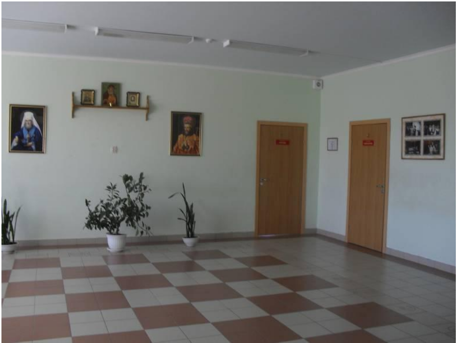
Холл первого этажа