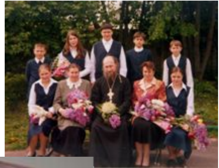
9 класс 2008 год