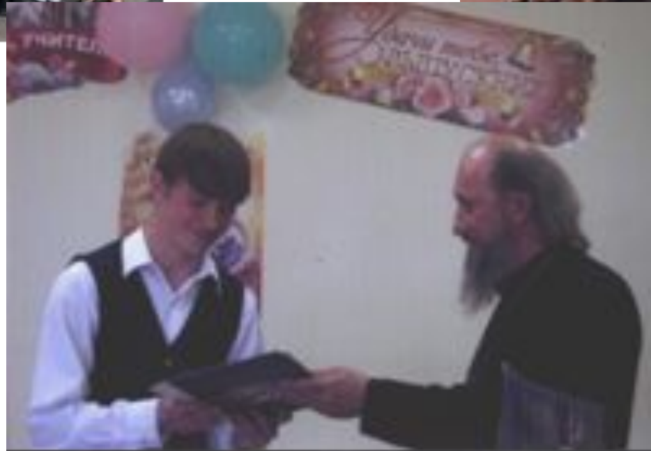
11 класс , 2010 год