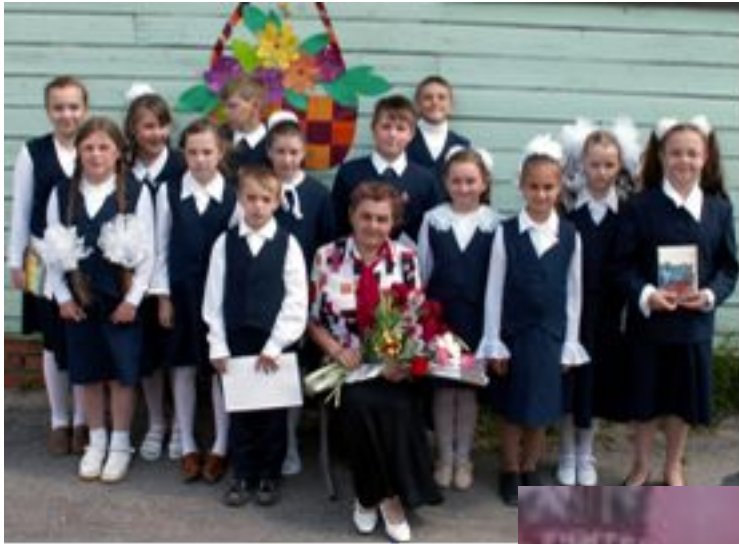
4 класс 2005 год