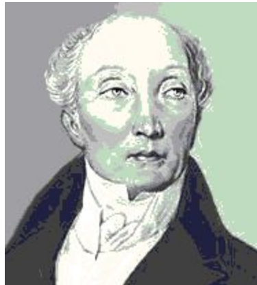
М.М. Сперанский право