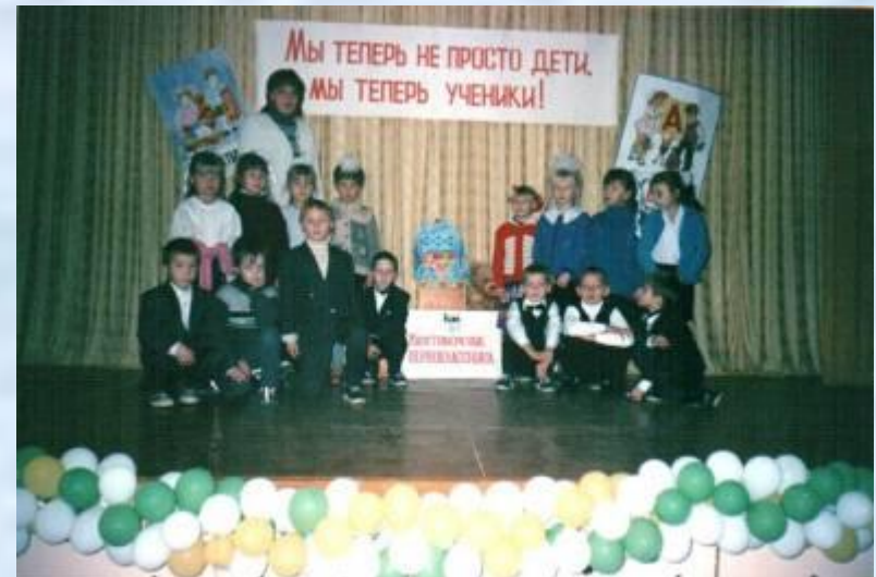
Посвящение в первоклассники