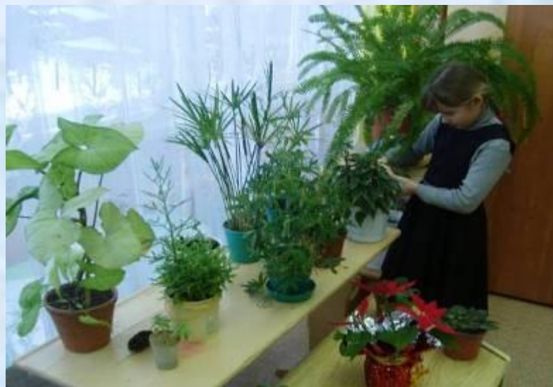
Кружок «Секреты цветоводства»