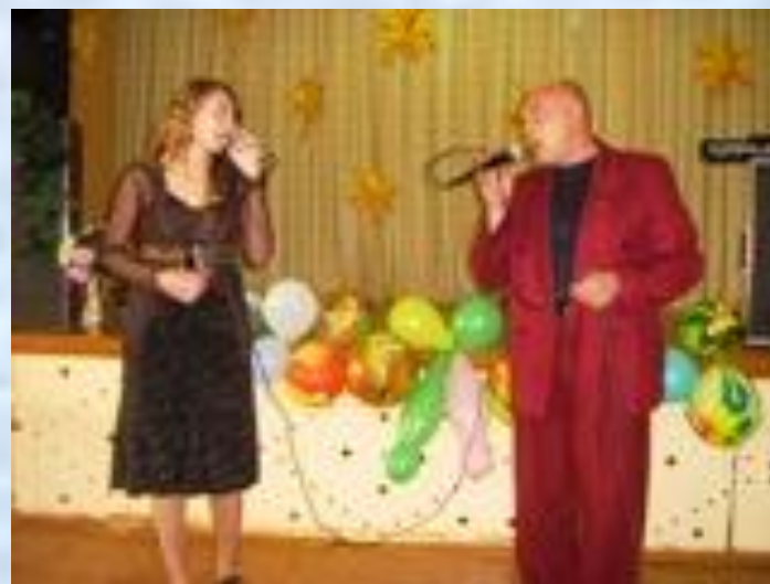
Но осень на дворе...