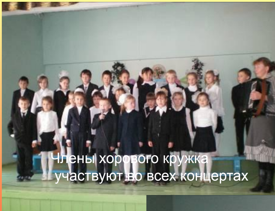
Члены хорового кружка участвуют во всех концертах