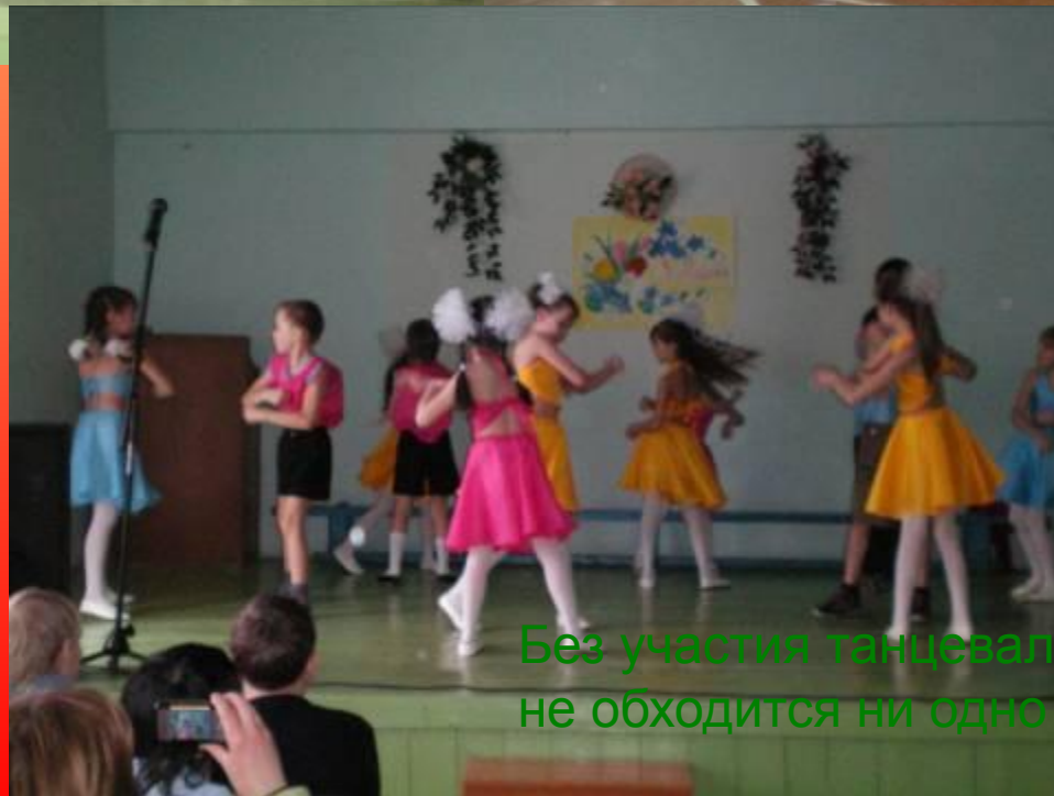
Без участия танцевального коллектива не обходится ни одно мероприятие