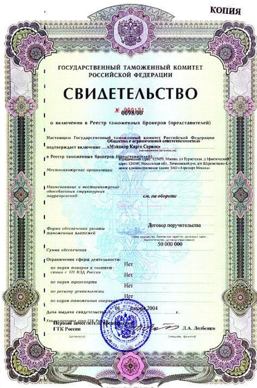
Лицензия таможенного брокера