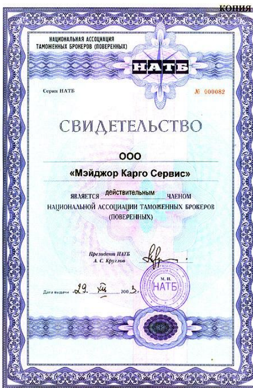
Членство в Национальной Ассоциации Таможенных Брокеров