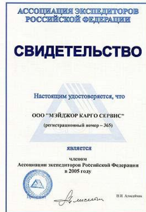
Членство в Ассоциации экспедиторов Российской Федерации