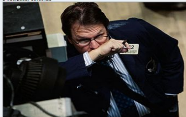
Трейдер на бирже