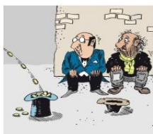
RIA "Новости" Предприниматели готовятся к тяжелым временам

Предприниматели готовятся к тяжелым временам, ждут снижения спроса и готовят сокращение персонала и остановки производства. Об этом говорит опрос, проведенный организацией среднего бизнеса "Деловая Россия" среди своих членов.