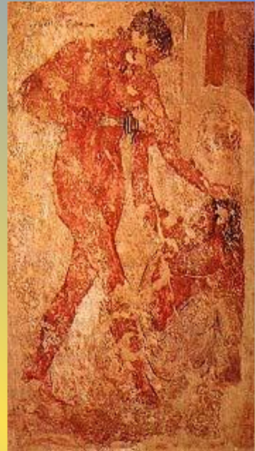
Фрески из виллы Мистерии в Помпеях