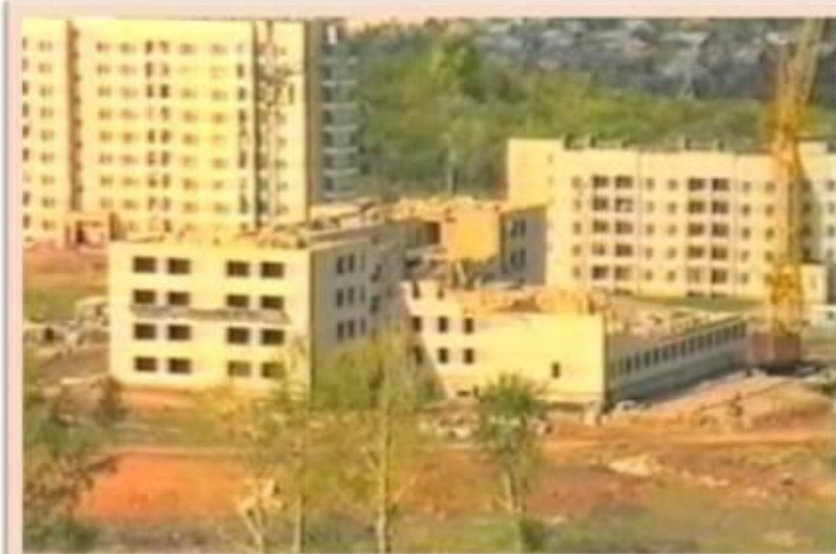
Строительная площадка школы