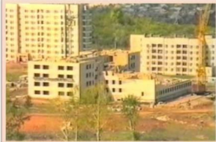
Строительная площадка школы