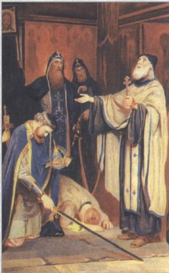
Преподобный Сергий благословляет Дмитрия на борьбу с Мамаем. Худ. А. Н. Новоскольцев