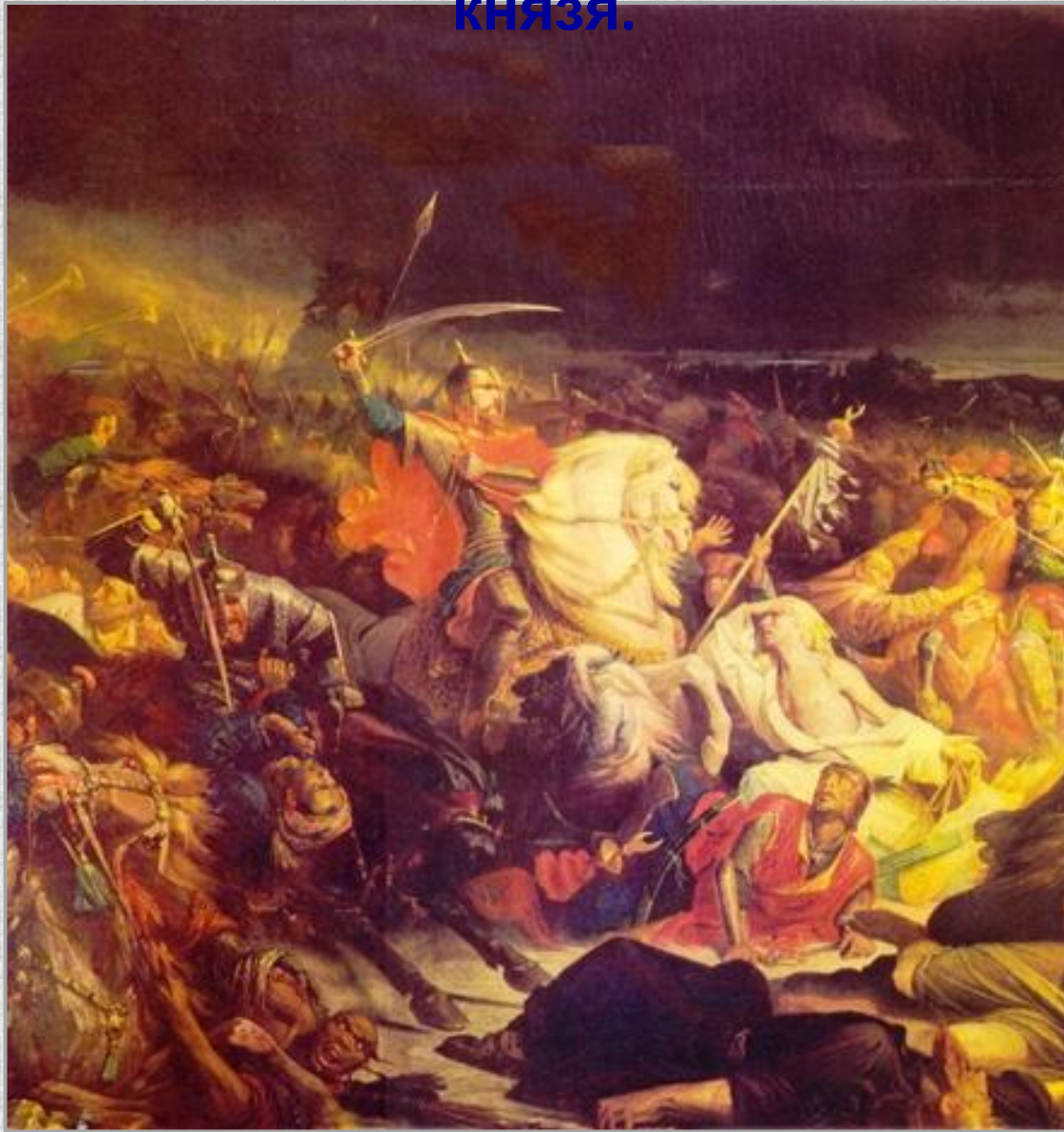
Куликовская битва. Адольф Ивон. 1859 г.