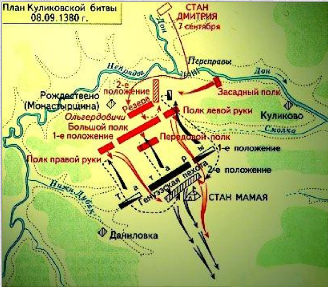
План Куликовской битвы 08.09.1380 г.

В центре стоял Большой полк. Правее и левее его – полки Правой илевой руки. Впереди главных сил были расположены Сторожевой и Передовой полки. За Большим полком был расположен частный резерв (конница). Засадный полк выполнял задачу общего резерва и был скрытно расположен в лесу.