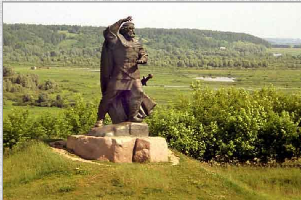
Памятник на Куликовом поле