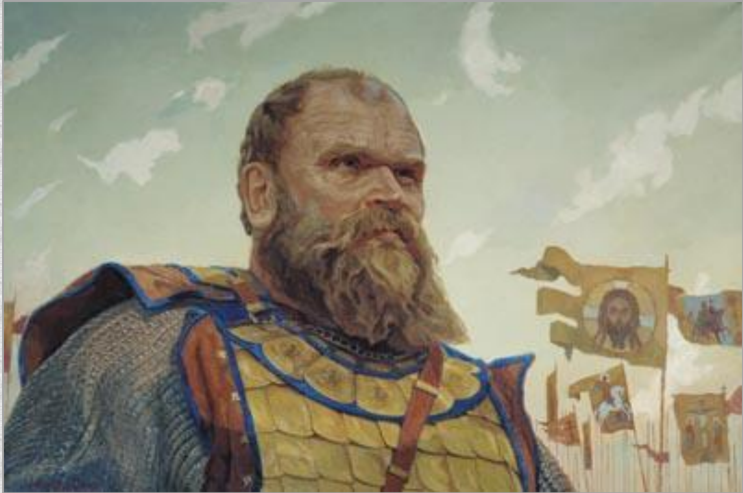
Воевода Дмитрий Боброк-Водичский

«Господине, отцы, и братиа, и чада, и друзи! Подвизайтесе, время нам благо прииде, сила бо Святого Духа помогает нам»