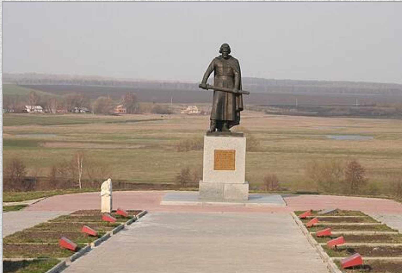
Памятник Дмитрию Донскому

В 1880 у с. Монастырщина на самом поле торжественно отпразднован день 500-летней годовщины битвы.