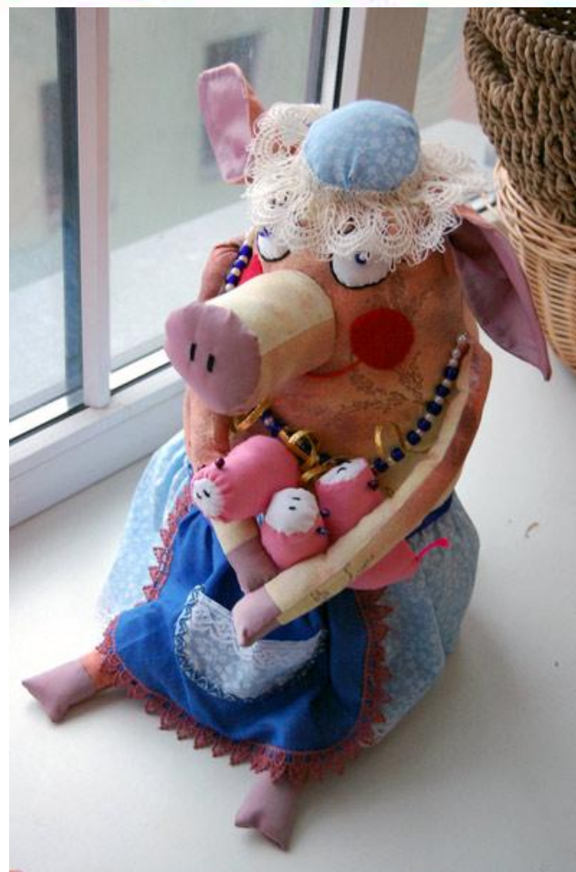
Хрюша с хрюшатами