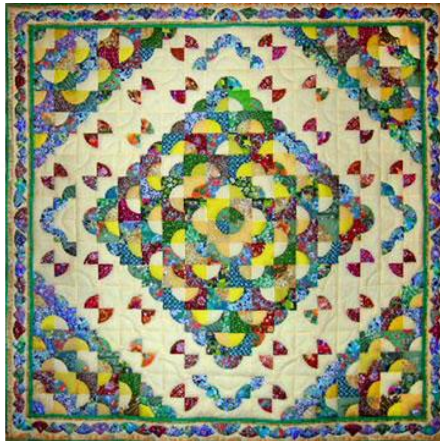
Одеяло “Цветы луговые”