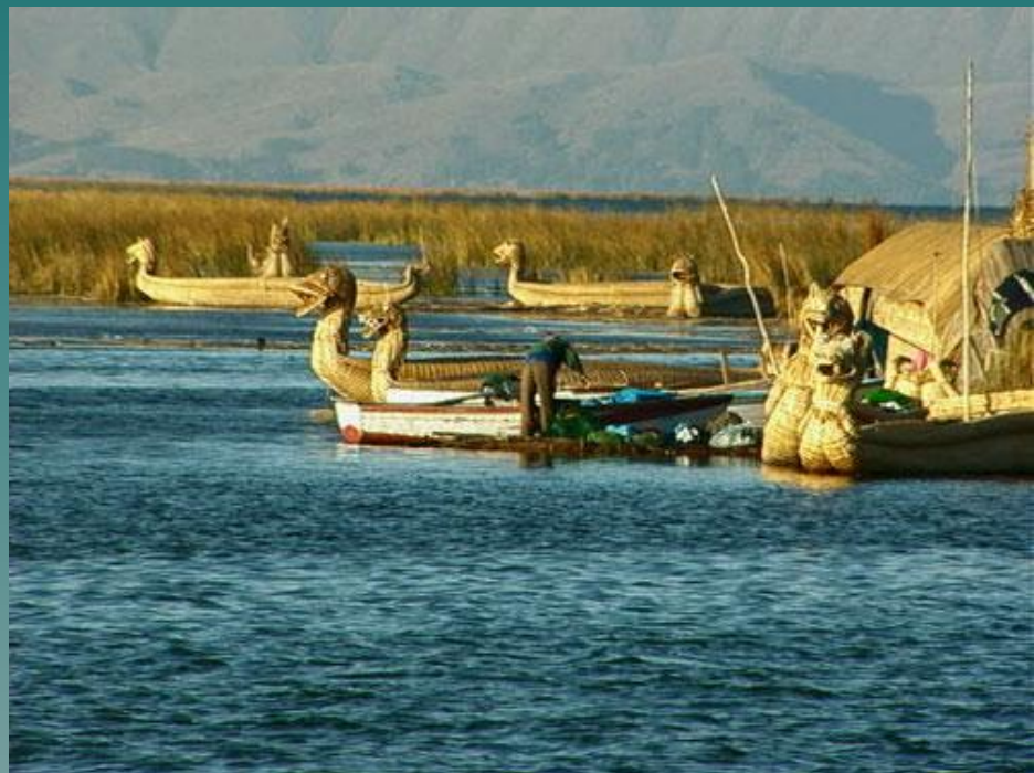
Тростниковые лодки индейцев