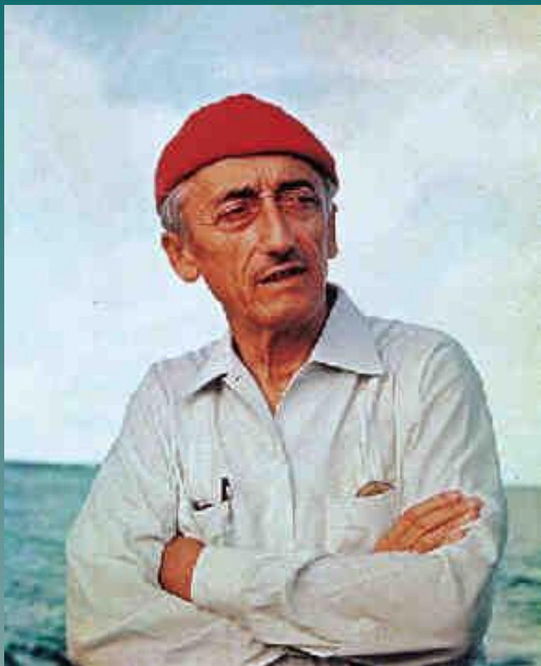
Жак Ив Кусто