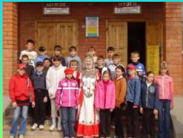
Музей Н.Я. Бичурин