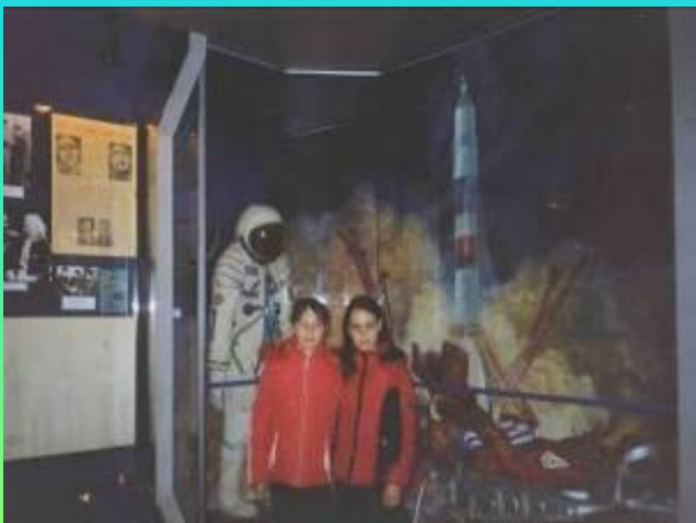
Музей А.Н. Николаева