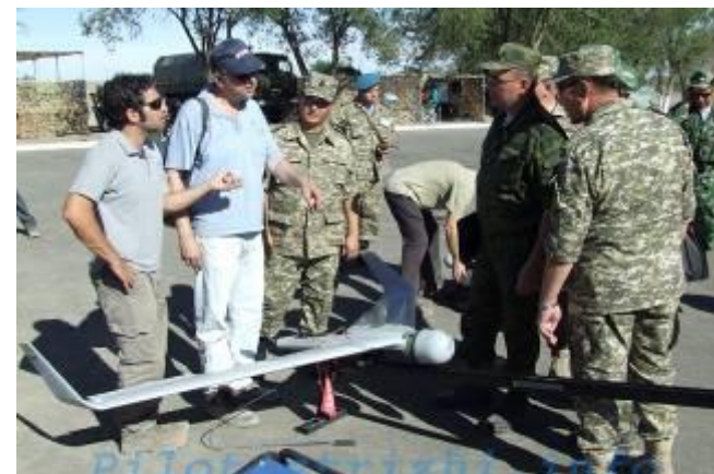
Представители израильской фирмы «Аэронотикс» с офицерами ВС Казахстана в ходе испытаний БПЛА «Орбитер», 2009 г.