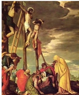
Голгофа. П. Веронезе. 1570г.