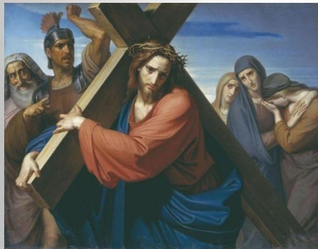
Несение креста. Ф. А. Моллер. 1869 г.