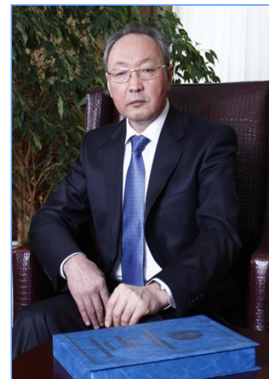
Бекназаров Бектас Абдыханович – Председатель Верховного Суда Республики Казахстан