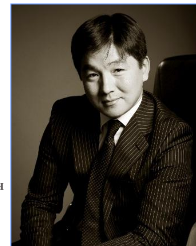
Байбек Бауыржан Кыдыргалиевич – Заместитель Руководителя Администрации Президента Республики Казахстан