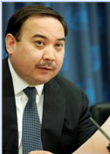
Казыханов Ержан Хозеевич – Министр иностранных дел Республики Казахстан