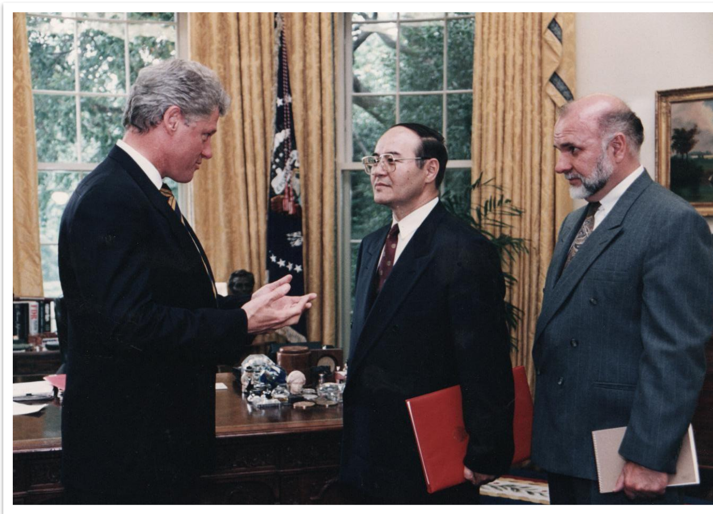
Первый Министр иностранных дел Независимого Казахстана, Директор Института Дипломатии Сулейменов Тулегай Скакович (по центру) с Президентом США Биллом Клинтонем, 1993 г.