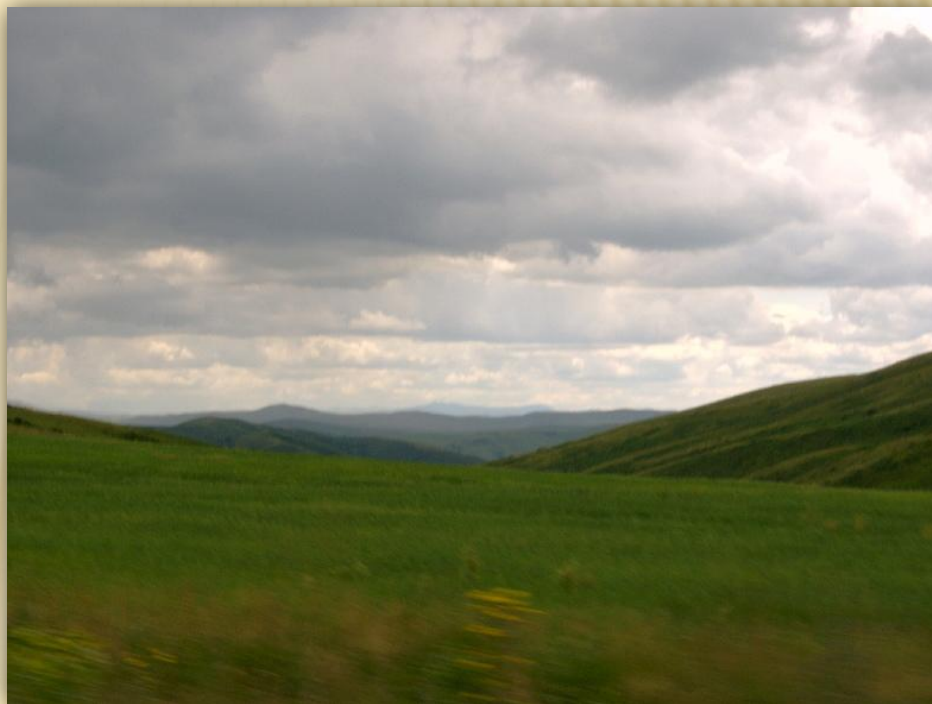
Природа Восточного Казахстана

Общая площадь земли в Казахстане составляет 2724,9 тыс. км 2 . Хотя территория и большая, но с каждым годом качество земли оставляет желать лучшего. Из-за неправильного освоения земель ухудшается плодородие почв, они подвергаются деградации, усиливаются процессы опустынивания. По последним данным, 180 млн. га, или 60% земель в республике превратились в пустыню. Из общей площади Казахстана равнины занимают 235 млн. га, 185 млн. га – пастбища, 34 млн. га – пашня.