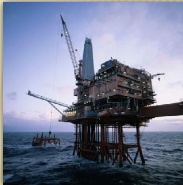
нефтяная вышка на Каспии

В последнее время экологическую обстановку республики ухудшают активная разработка нефтяных месторождений на Каспии и в близлежащих регионах, а также повышение уровня Каспийского моря. Резкий скачок уровня моря вывел из строя многочисленные буровые скважины, нефтехранилища. Кроме того, реки Урал и Волга вливают в каспийскую воду немало отравляющих веществ.