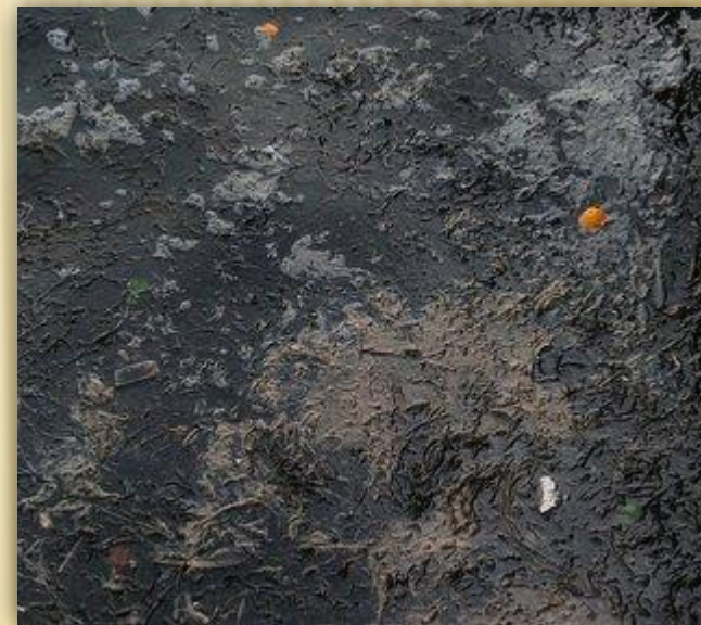
Сгустки нефти на воде