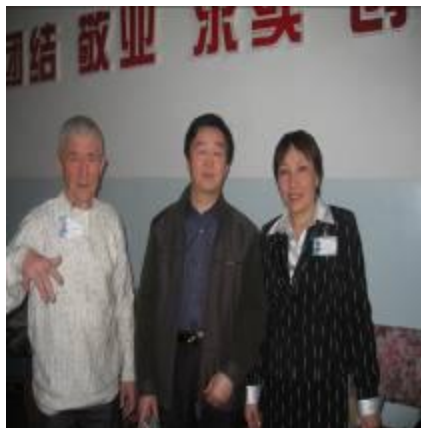
Делегация кафедры педагогики и психологии в Синьзянском педагогическом институте (Китай)