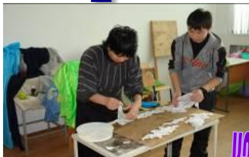
кабинеты методик начального обучения