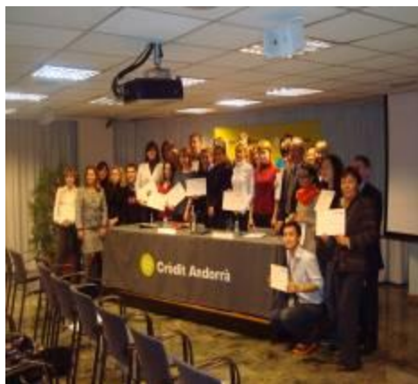
Делегация кафедры в Министерстве туризма княжества Андорра