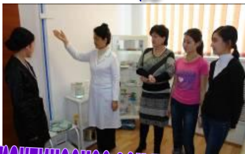
практическое занятие по валеологии