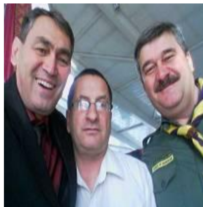
Международный фестиваль во Всероссийском детском центре «Орленок»