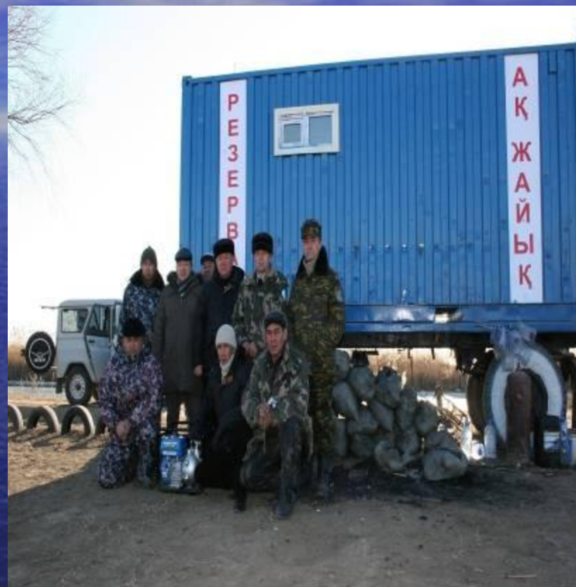
Стационарный пост №2