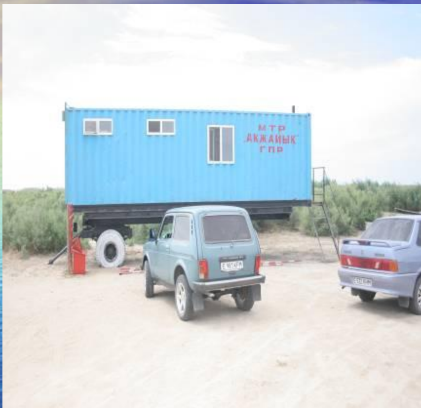
Стационарный пост №1

На сегодняшний день на территории ГУ ГПР «Ақжайық» размещено 2 стационарных инспекторских поста