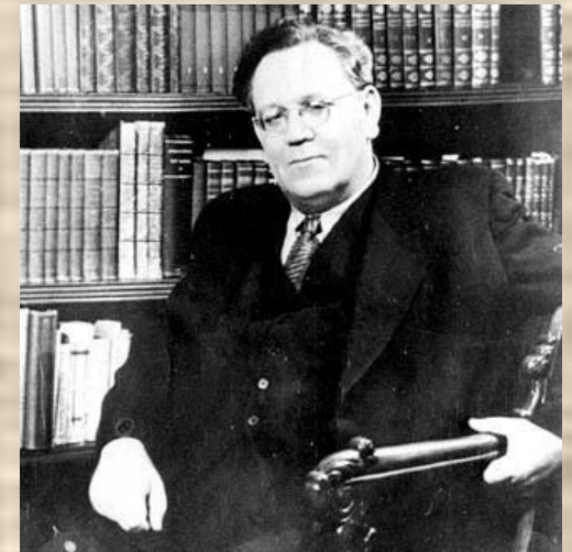
С. Я. Маршак