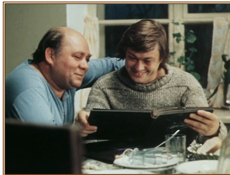
К/Ф «Старший сын» режиссёра Виталия Мельникова, в ролях: Евгений Леонов — Сарафанов, Николай Караченцов — Бусыгин

Андрей Григорьевич одинок и поэтому привязывается к «старшему сыну».