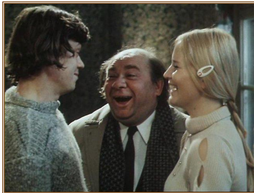
К/Ф «Старший сын» режиссёра Виталия Мельникова, в ролях: Евгений Леонов — Сарафанов, Николай Караченцов — Бусыгин, Наталья Егорова — Нина Сарафанова

«Старший сын» становится частым и желанным гостем этой семьи.