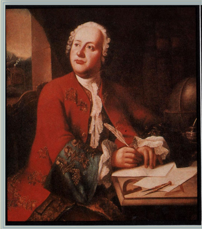
М.В.Ломоносов- великий сын России.