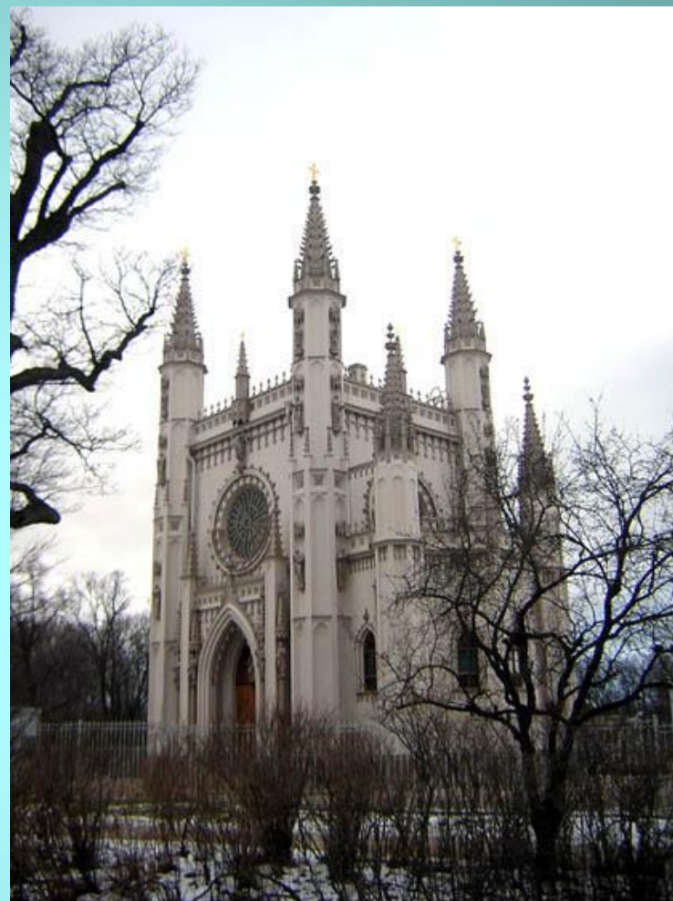
Готическая капелла парк Александрия Петергоф архитектор Карл Шинкель