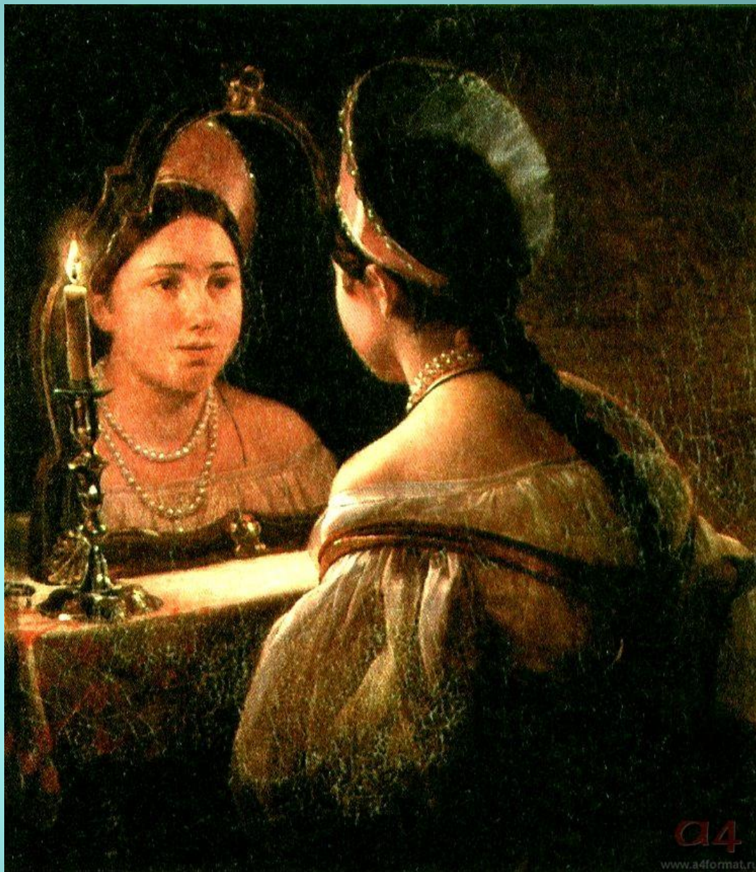
Карл Брюллов. Гадающая Светлана.

Вот красавица одна; К зеркалу садится; С тайной робостью она В зеркало глядится; Темно в зеркале; кругом Мертвое молчанье; Свечка трепетным