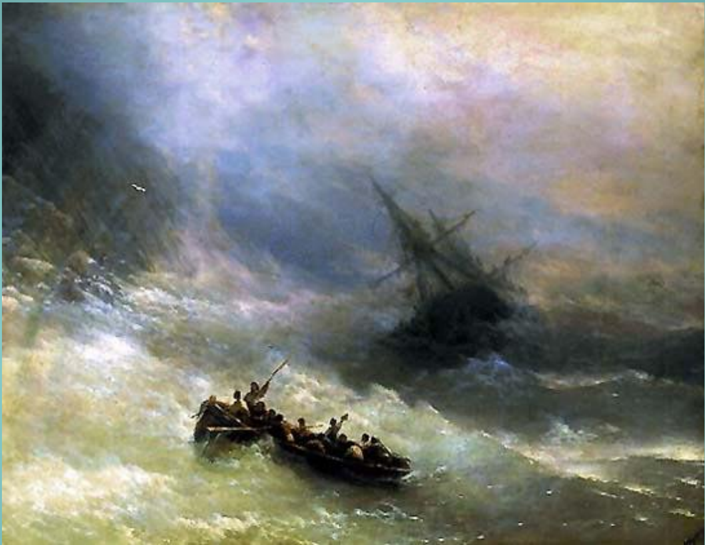
Иван Айвазовский Радуга