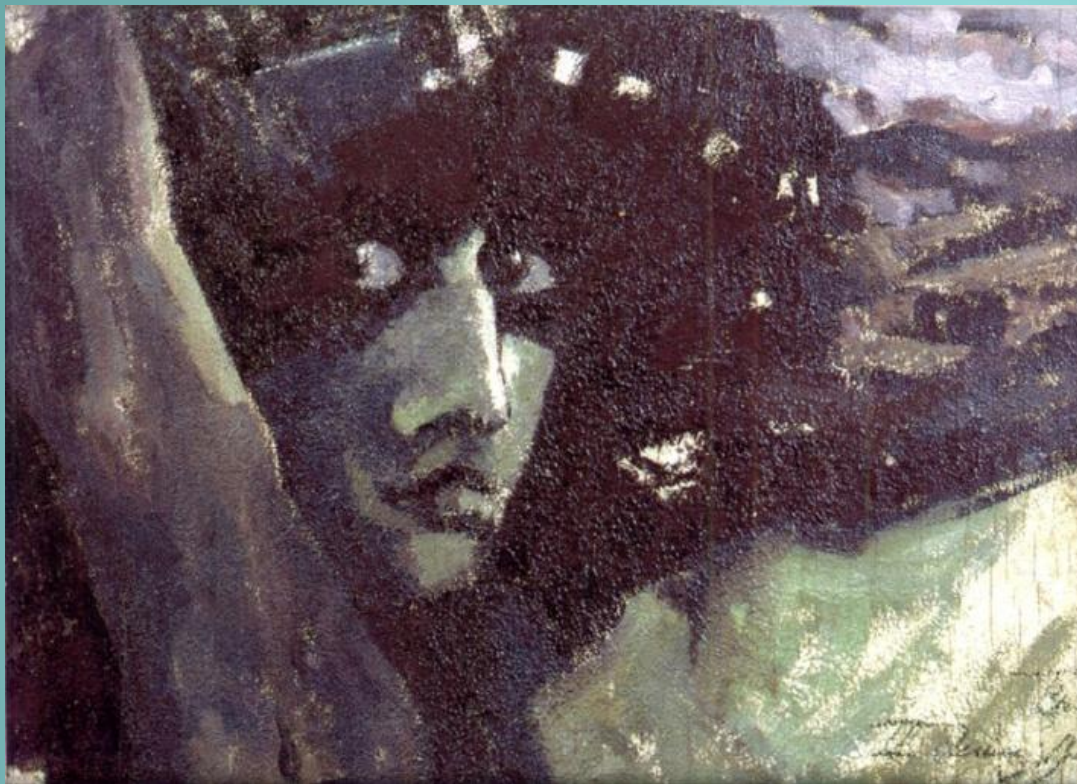
Михаил Врубель «Демон»

Люблю тебя не здешней страстью, Как полюбить не можешь ты: Всем упоением, всей властью Бессмертной