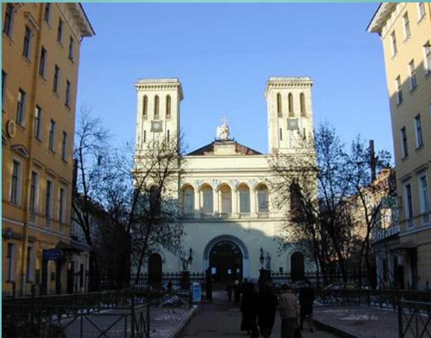
Лютеранская церковь в Петербурге Архитектор Александр Брюллов