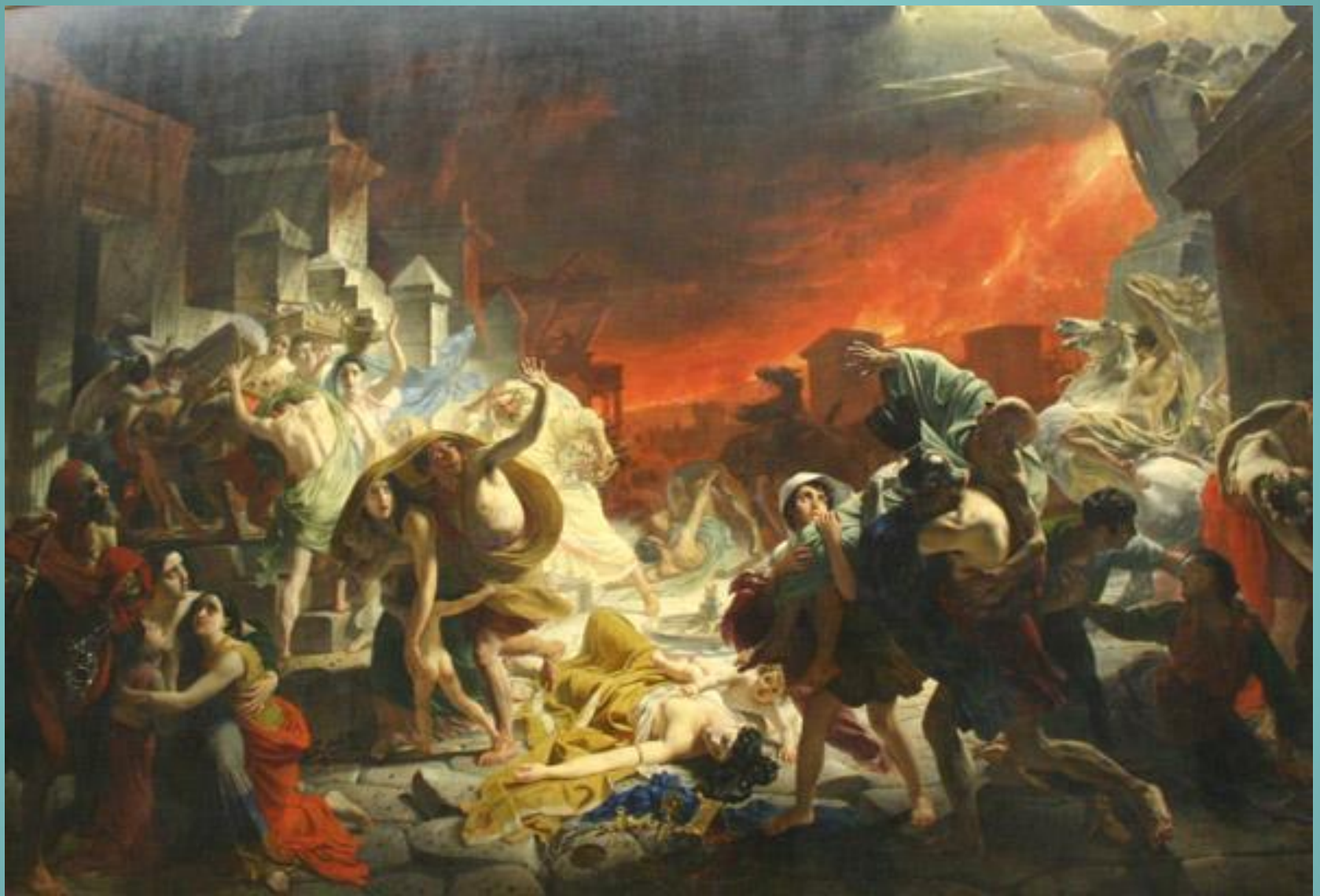
Карл Брюллов Последний день Помпеи