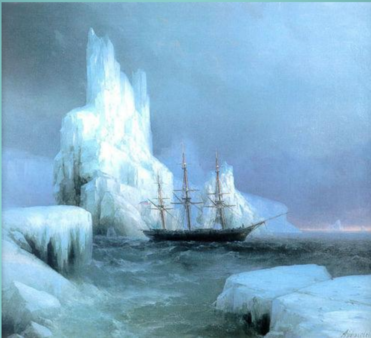
Иван Айвазовский Ледяные горы