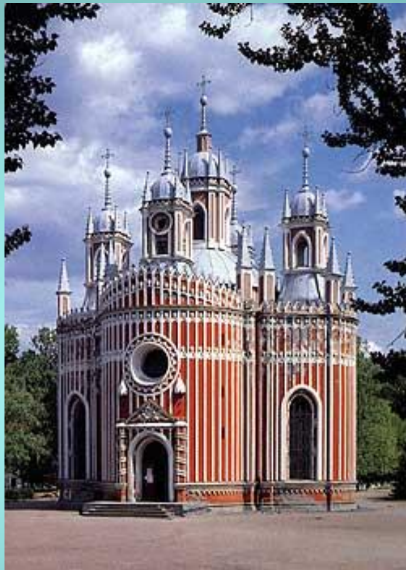
Чесменская церковь в Петербурге архитектор Юрий Фельтен