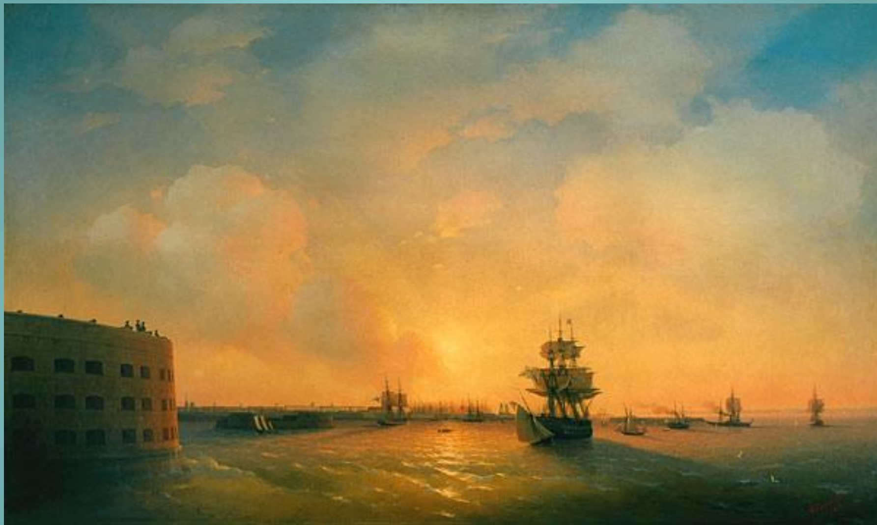
Иван Айвазовский Кронштадт. Форт император Александр