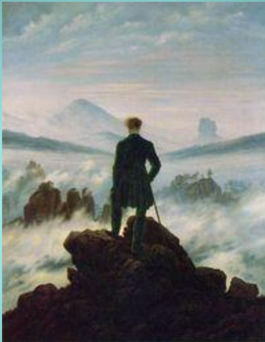
Каспар Фридрих Странник над туманным морем