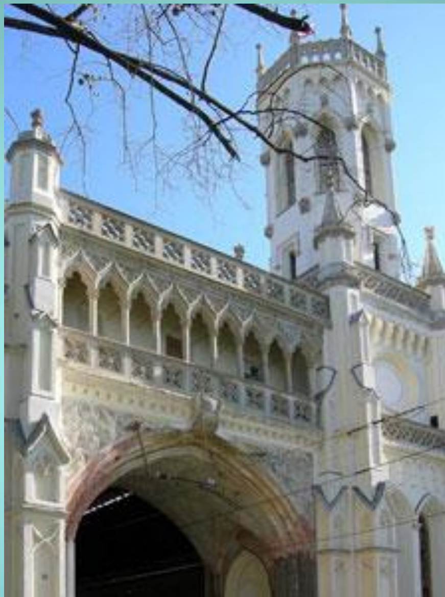
Вокзал в Петергофе архитектор Николай Бенуа