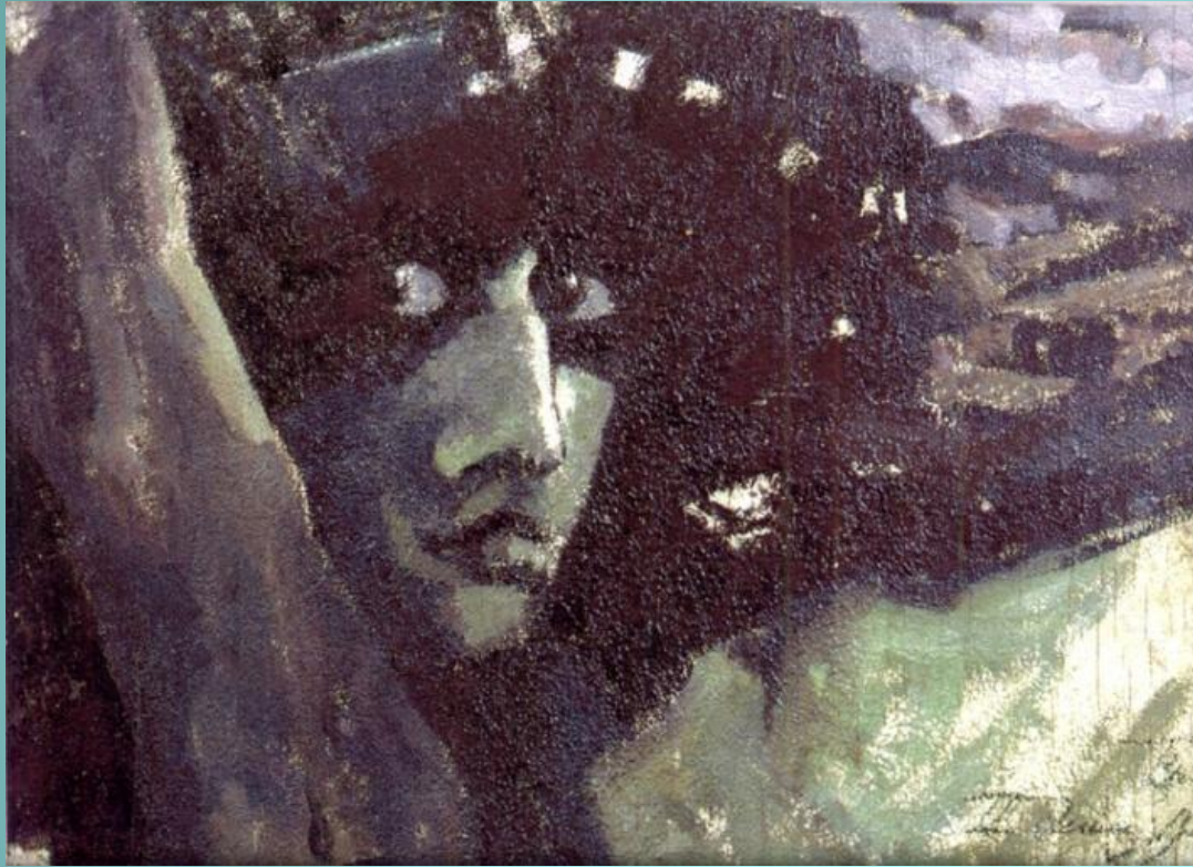
Михаил Врубель «Демон»

Люблю тебя не здешней страстью, Как полюбить не можешь ты: Всем упоением, всей властью Бессмертной