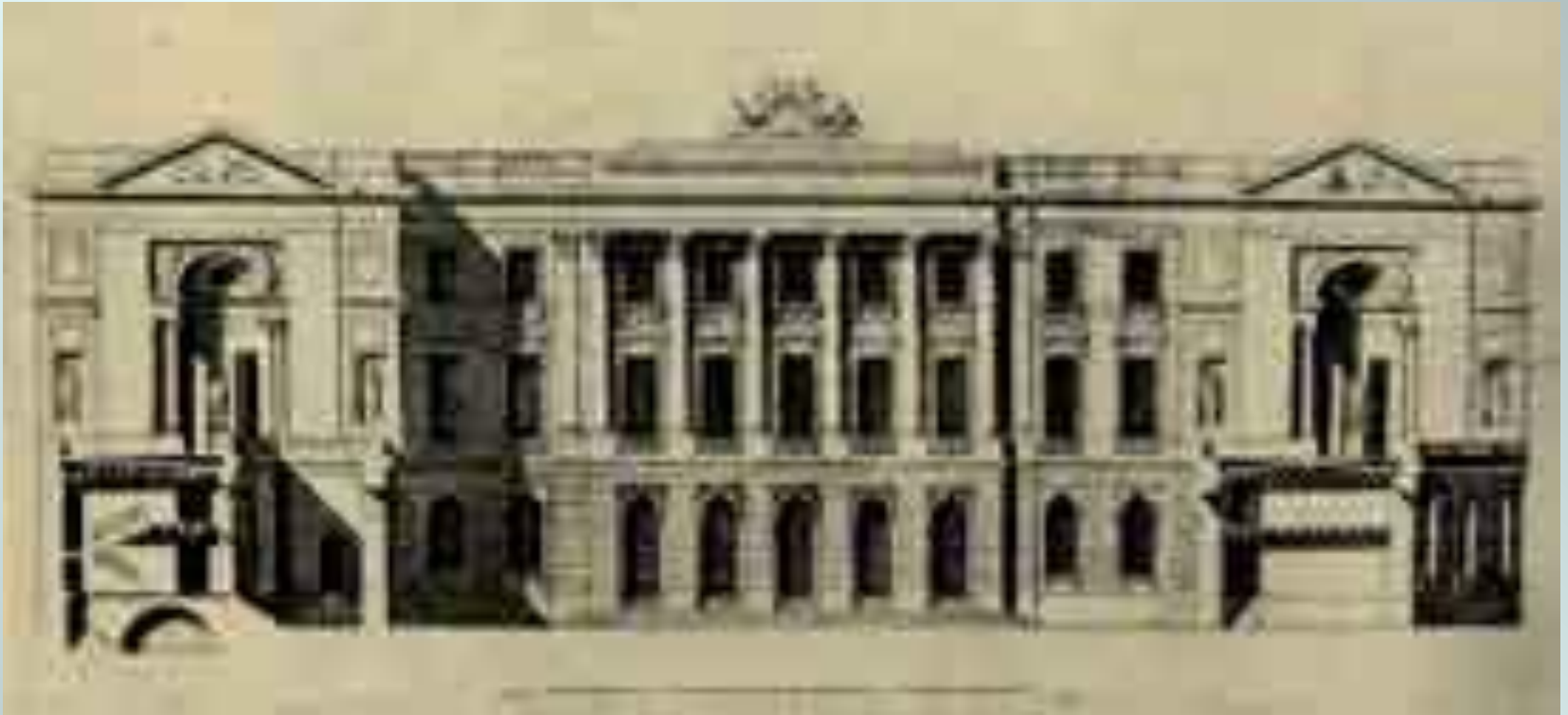
Петербург. Юнкерская школа