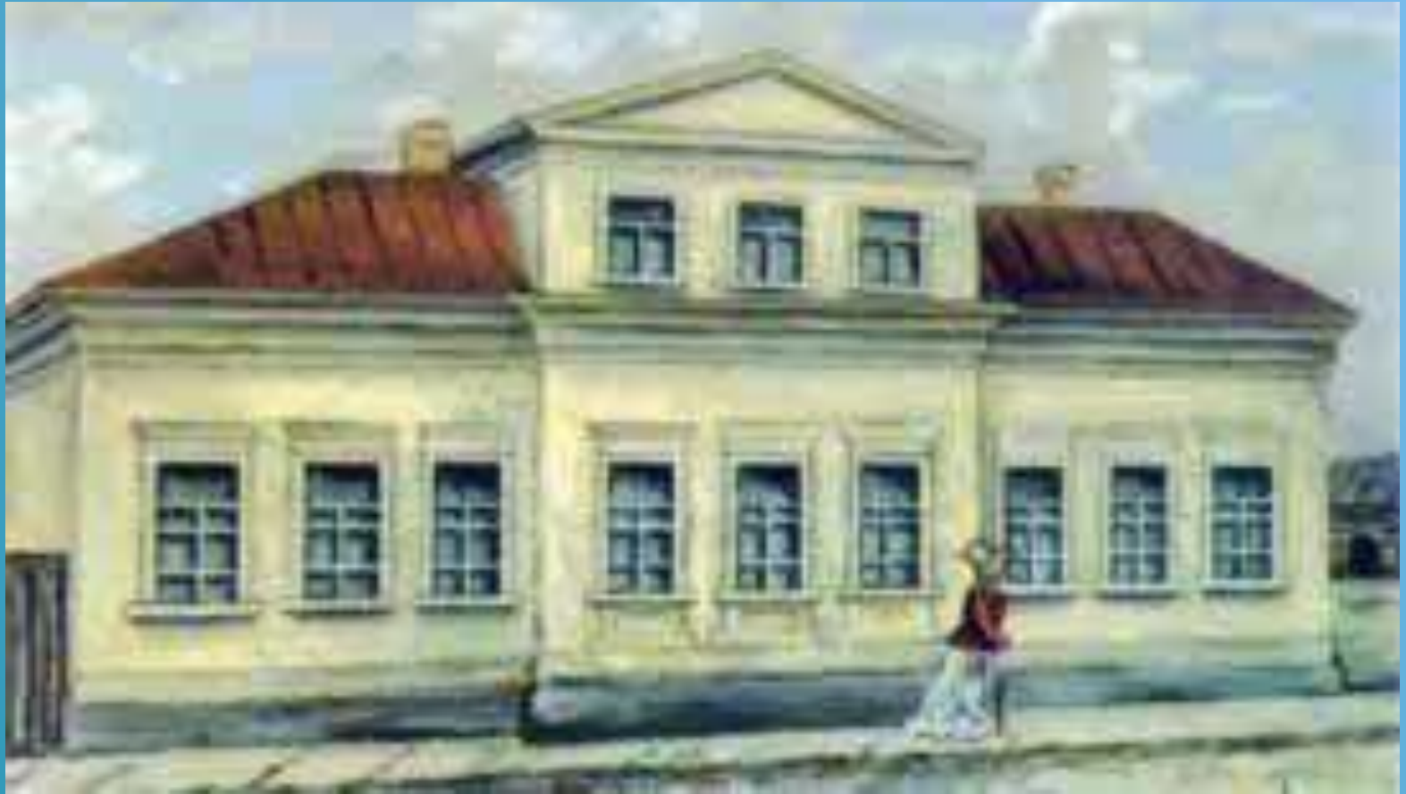
Дом в Москве.