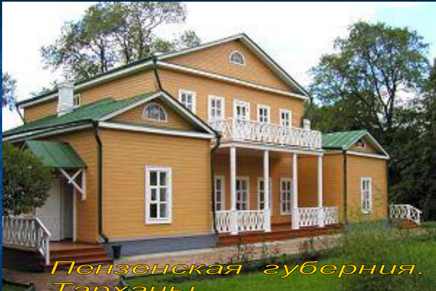
Пензенская губерния. Тарханы.