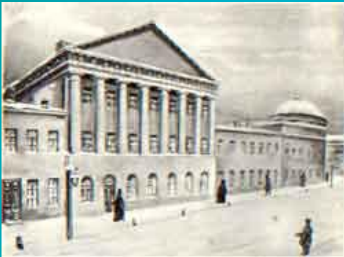
Москва. Благородный пансион.