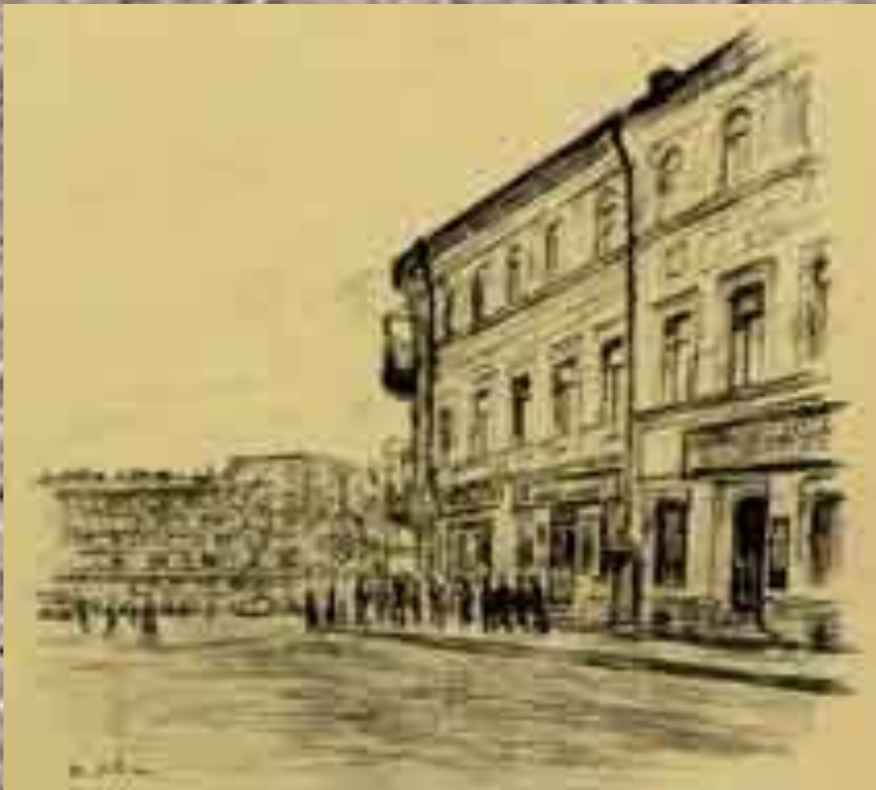
Москва. Дом, где родился М.Ю.Лермонтов