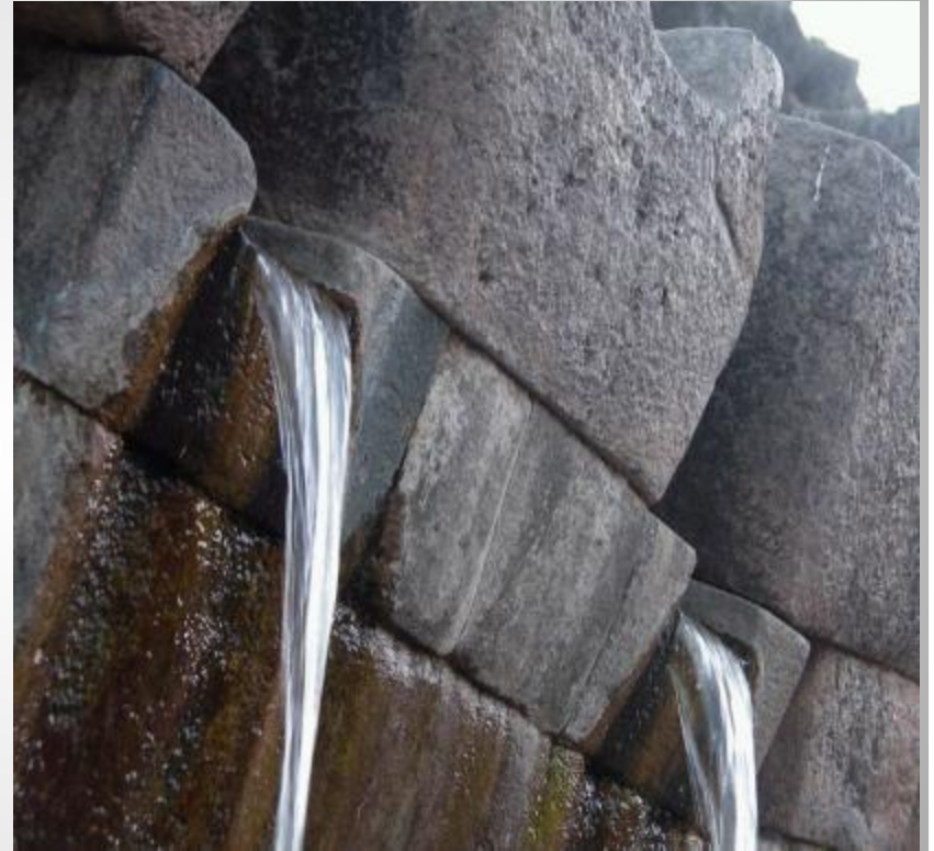
Водопровод средних веков