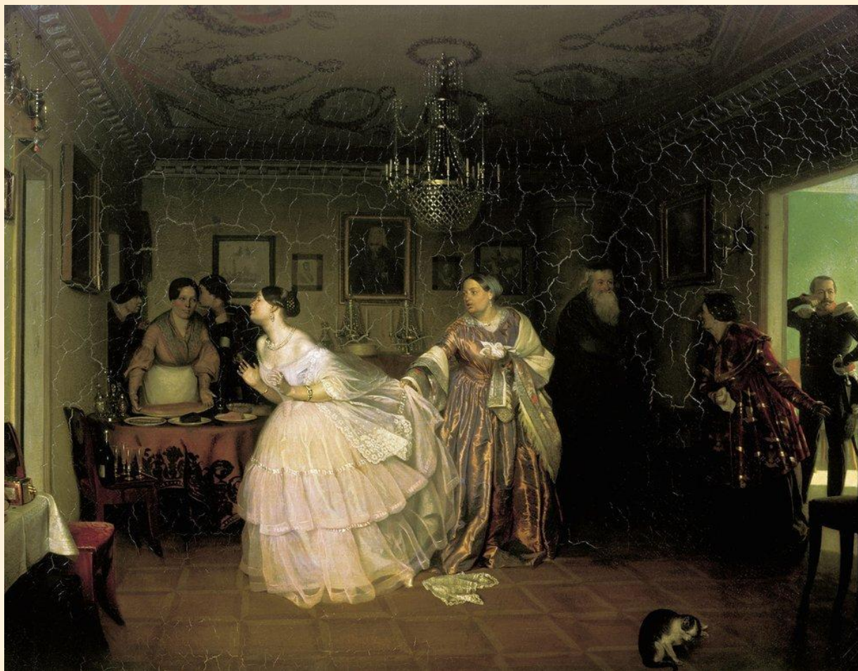
П.А. Федотов Сватовство майора