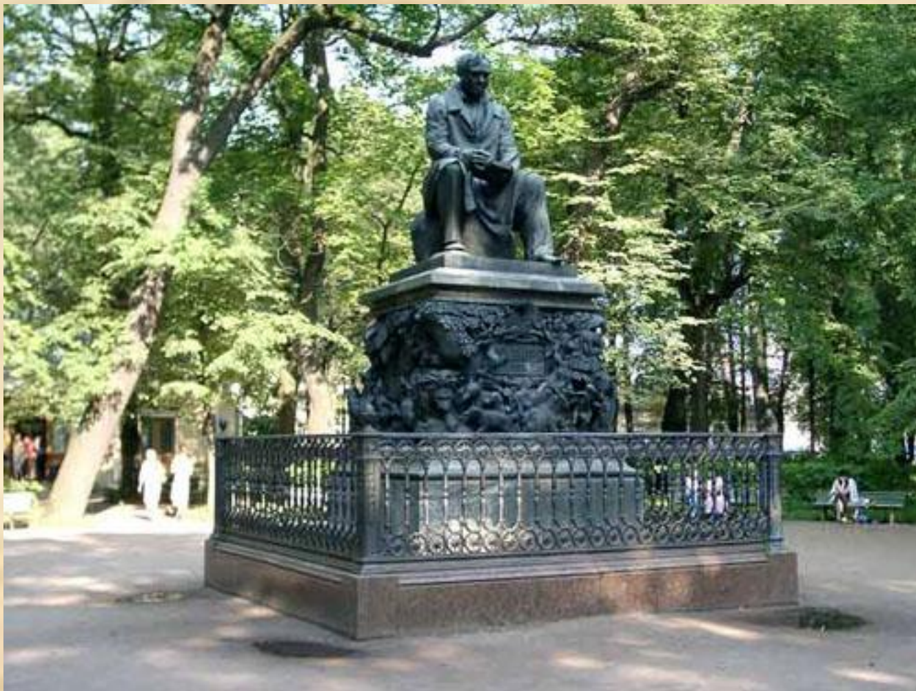
П.К. Клодт Памятник И.А. Крылову