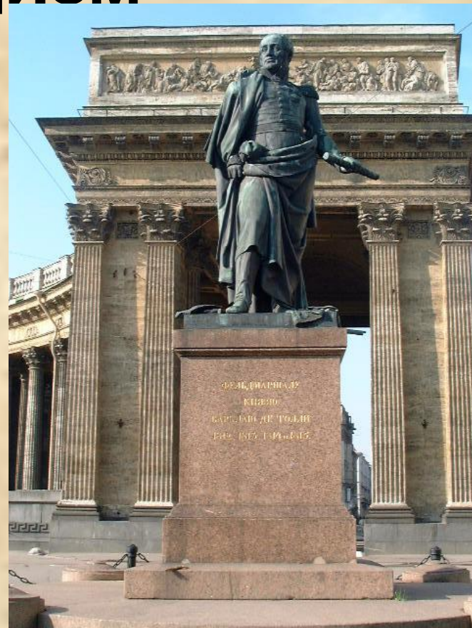
Памятник М.Б. Барклаю де Толли