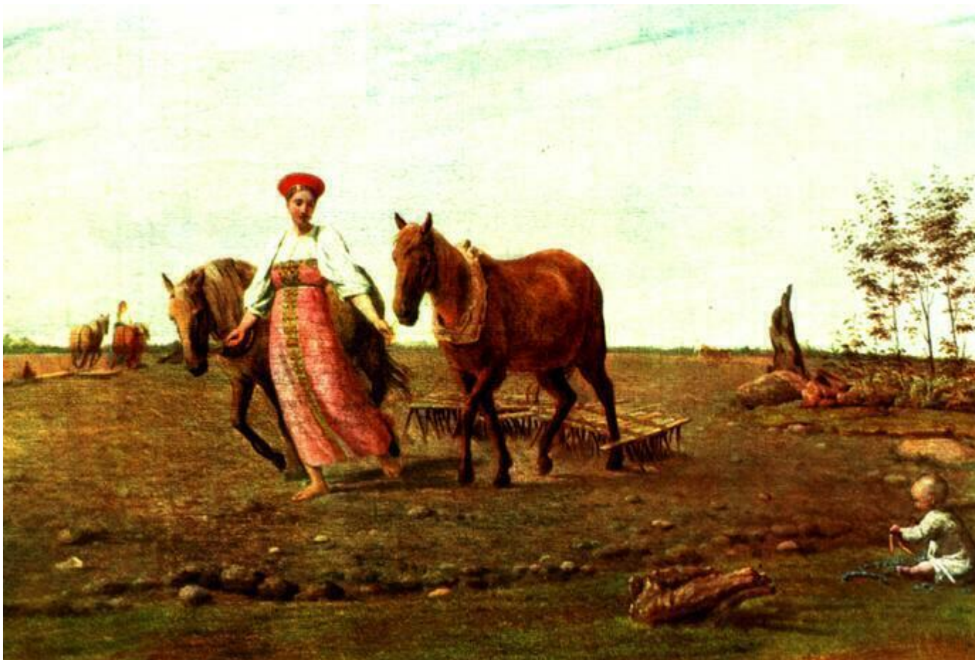
А.Г. Венецианов На пашне.Весна