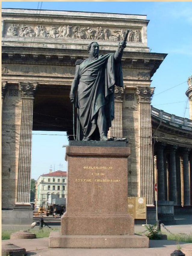
Памятник М.И. Кутузову