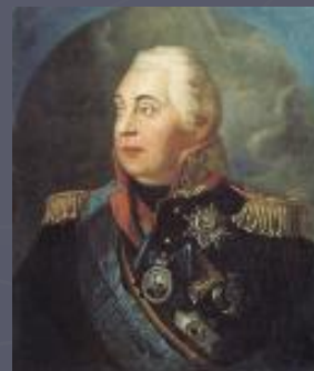
Кутузов Михаил Илларионович