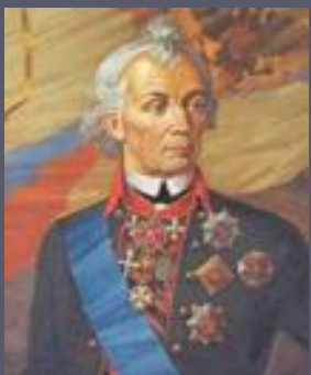
Суворов Александр Васильевич