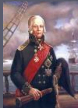
Ушаков Федор Федорович