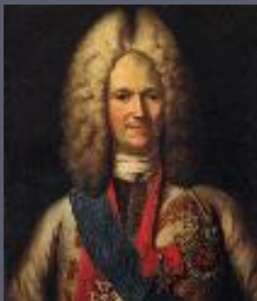
Александр Данилович Меншиков