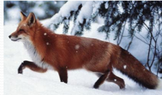
лисица – лисёнок