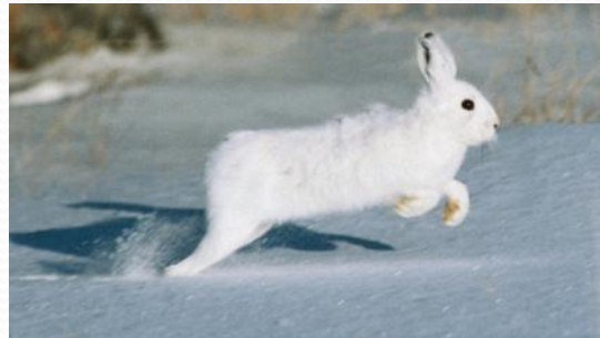
заяц - зайчонок