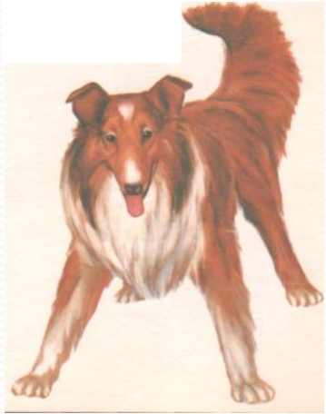
собака - щенок