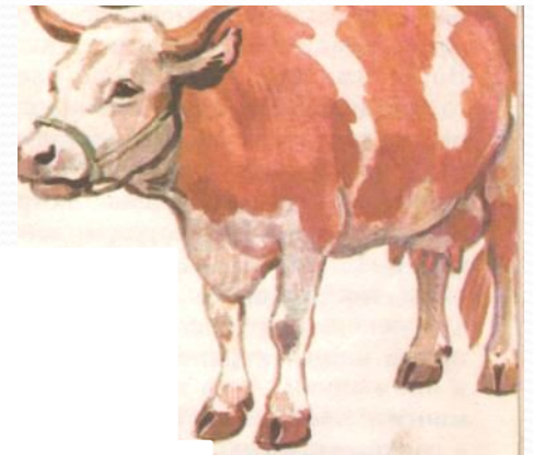
корова - телёнок