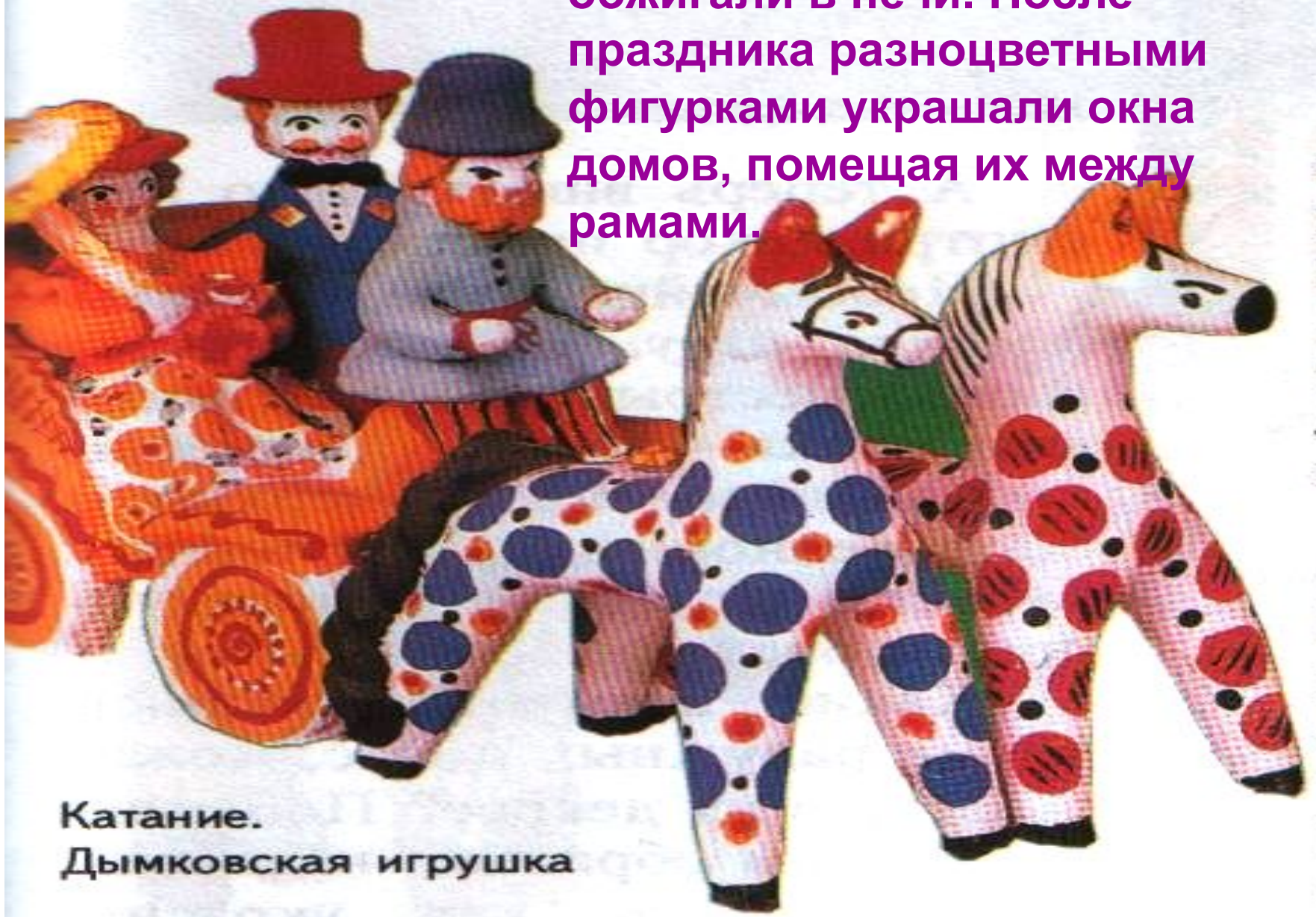
Катание. Дымковская игрушка

Игрушки крестьяне лепили из местной красной глины и обжигали в печи. После праздника разноцветными фигурками украшали окна домов, помещая их между рамами.