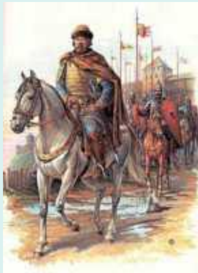
Князь и его дружина.