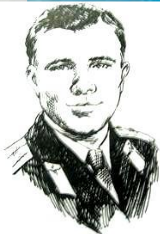
Ю. А. Гагарин

Самые большие достижения в области покорения космоса принадлежат нашей стране-России.