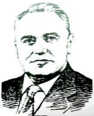
С. П. Королев