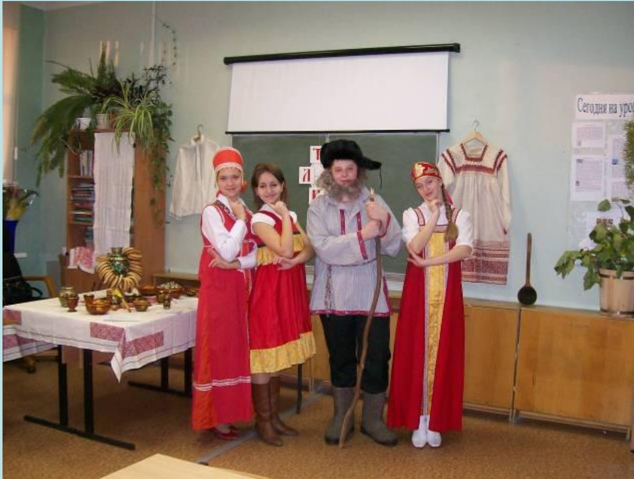
Празднование Дня Гимназии - Изба Деда-Всевида