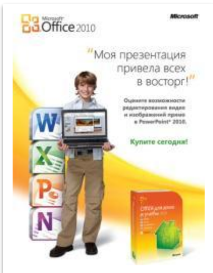
Брошюра Office 2010