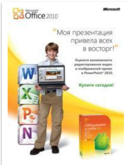
Брошюра Office 2010