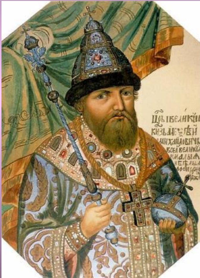
царь Алексей Михайлович

Указ 1648 года: «А где объявятся домры, и сурны, и гудки, и гусли, и хари, и всякие гудебные сосуды... велел изымать и, изломав те бесовские игры, велел жечь»