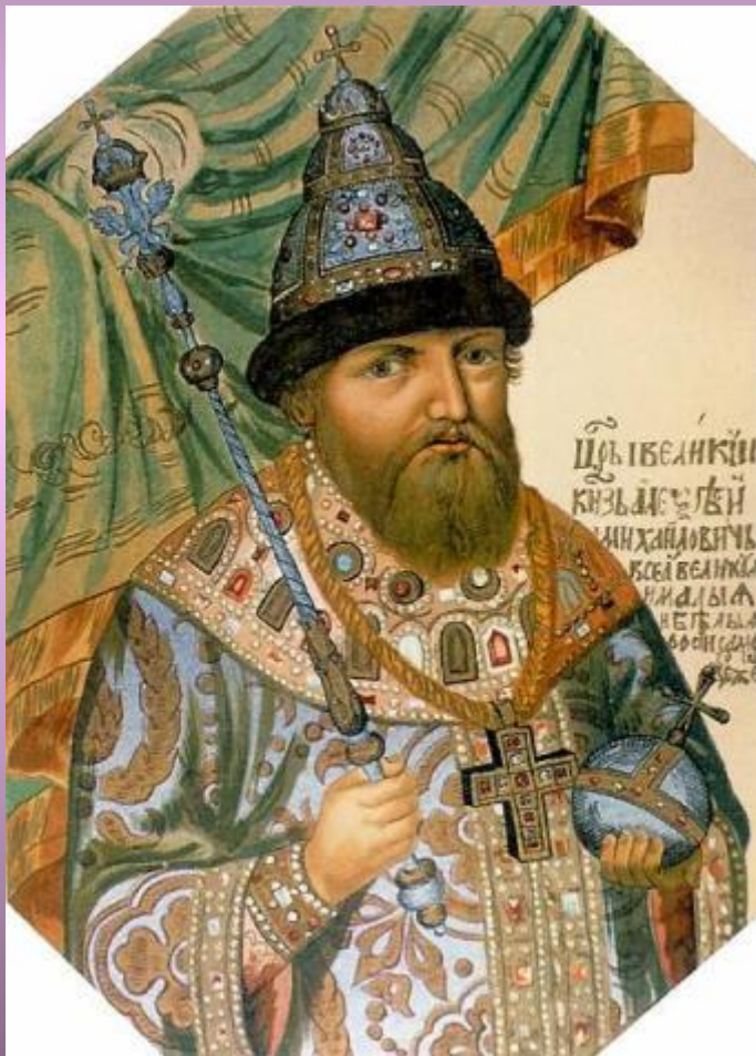
царь Алексей Михайлович

Указ 1648 года: «А где объявятся домры, и сурны, и гудки, и гусли, и хари, и всякие гудебные сосуды... велел изымать и, изломав те бесовские игры, велел жечь»