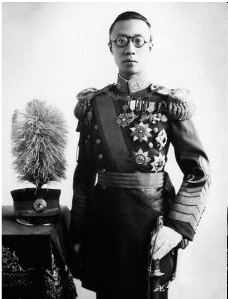
Император Пу И Кан Дэ