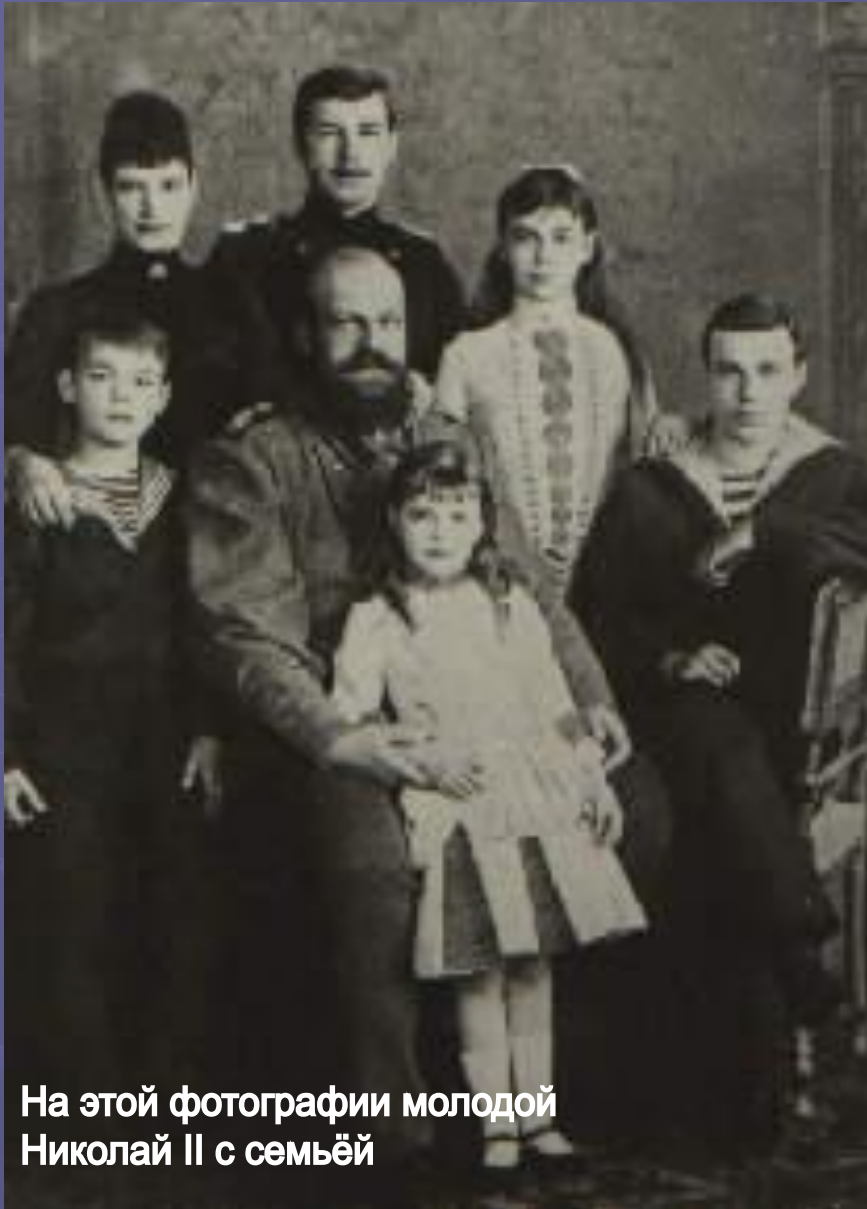
На этой фотографии молодой Николай II с семьёй