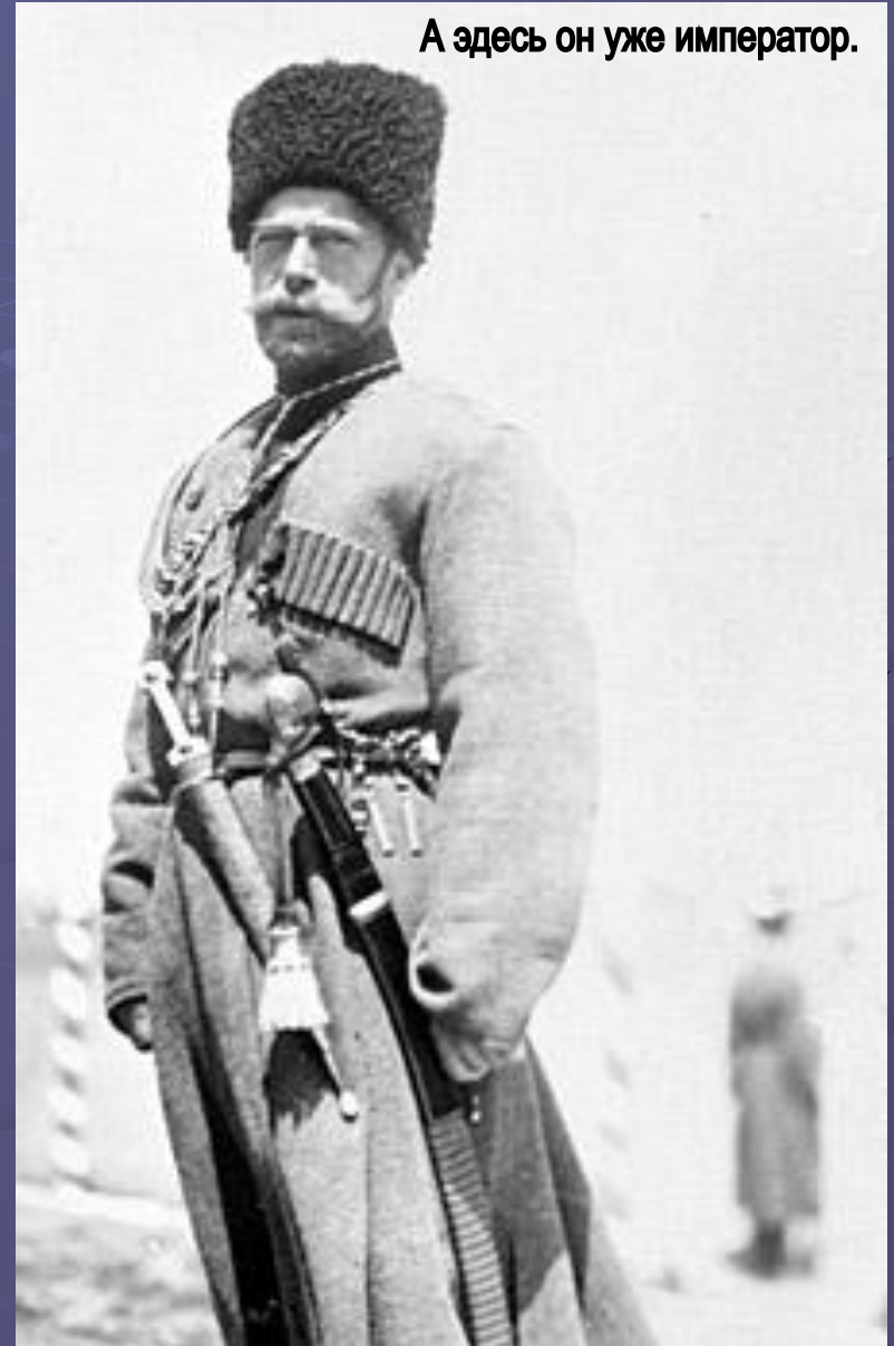
А здесь он уже император.