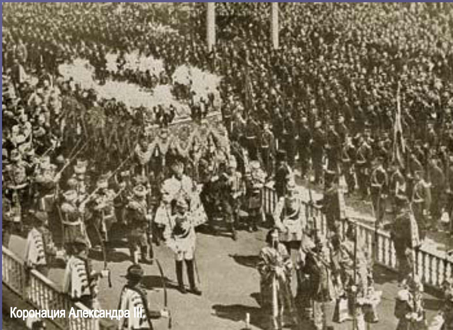
Коронация Александра III.

Появившись в 19 веке, фотография позволила на всегда запечатлить великие события.