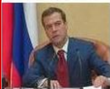
Фото (всего 145)