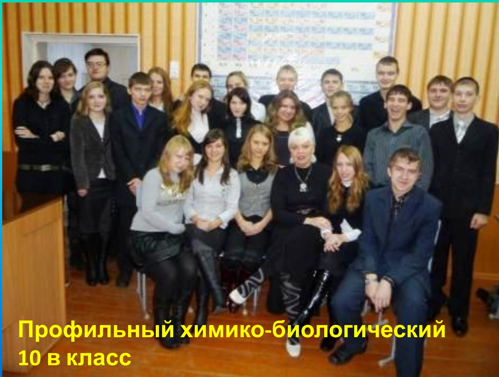
Профильный химико-биологический 10 в класс