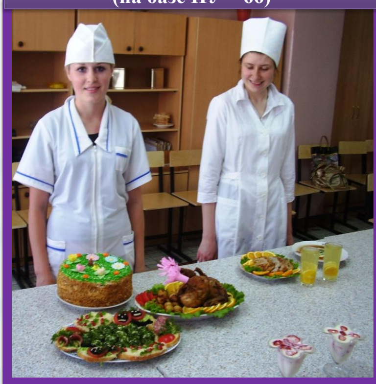
Повар (на базе ПУ – 66)