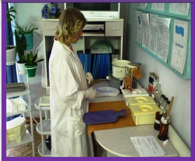
Основы оказания первой медицинской помощи (на базе мед. колледжа)