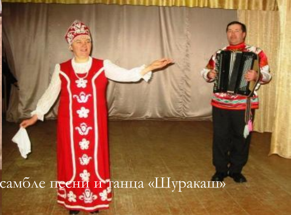
Участие в Народном ансамбле песни и танца «Шуракаш»