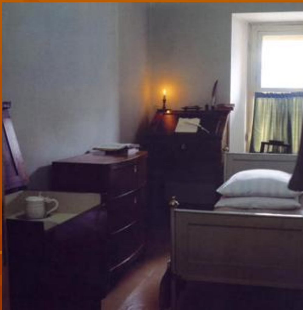
Комната А. С. Пушкина