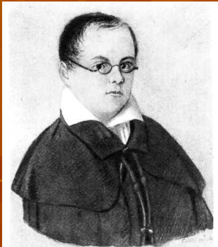
А. А. Дельви́г