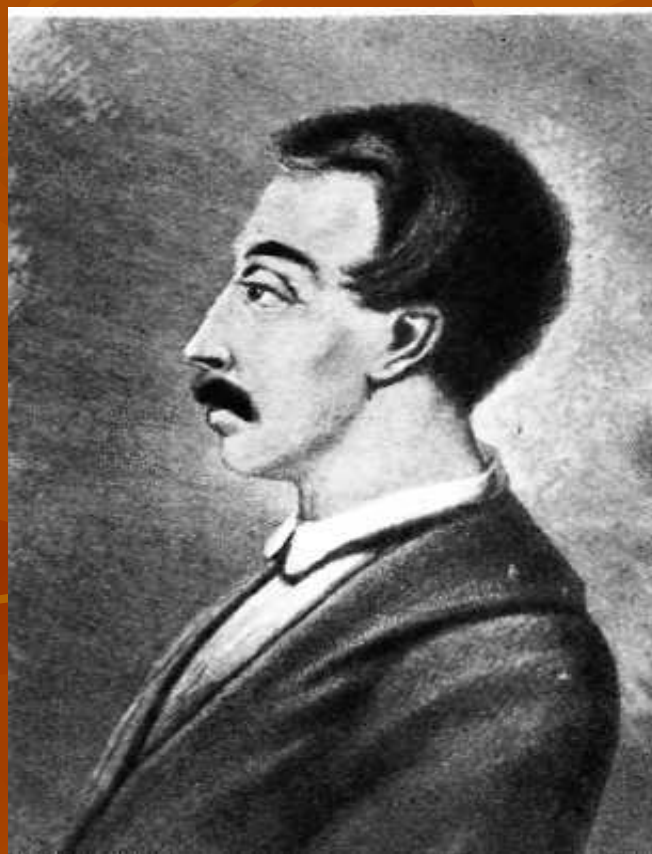
В. К. Кюхельбекер