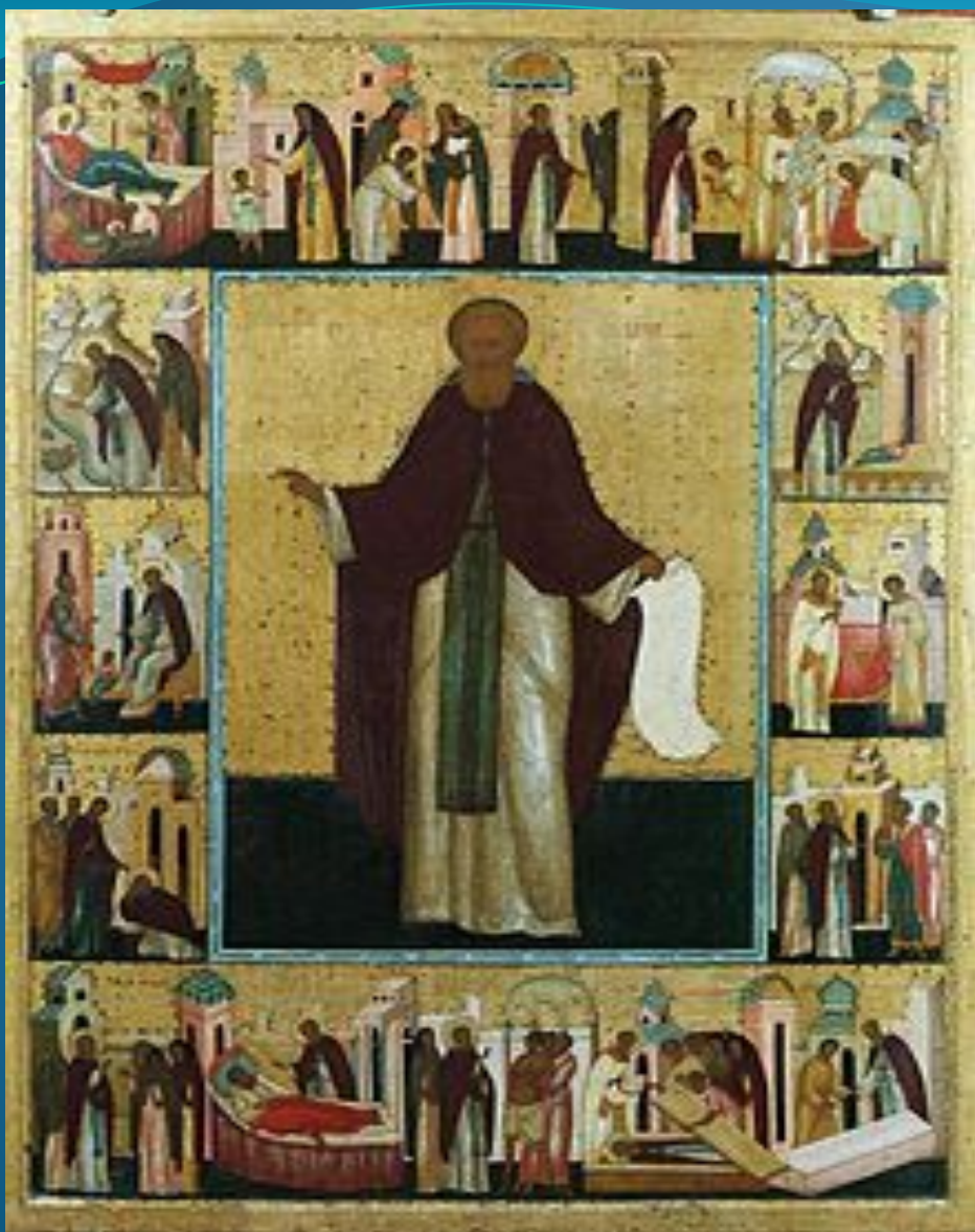
Икона «Сергий Радонежский в житии», XV век.