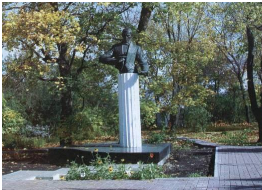
Памятник С.В. Рахманинову. Установлен в 1982 в с. Ивановка Уваровского р-на. Скульптор К.Я. Малофеев. Медь, выколотка.