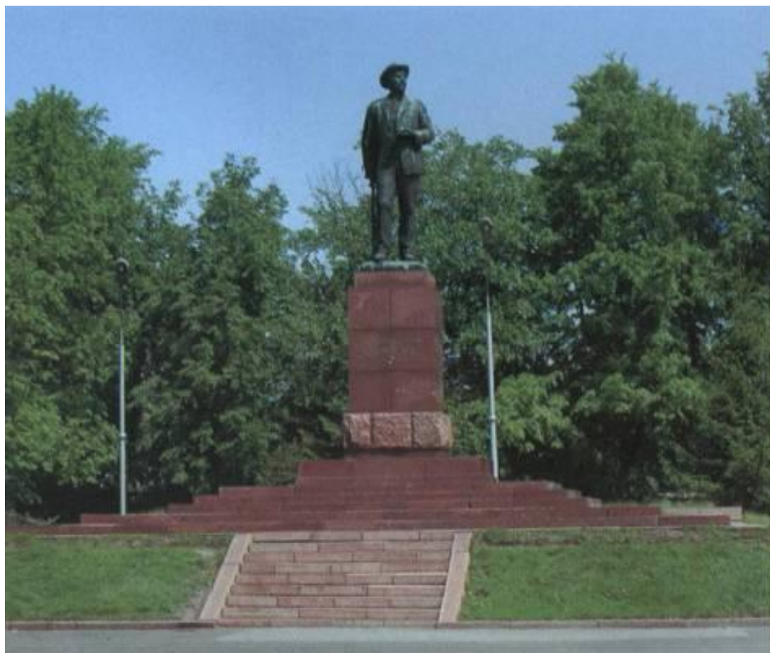
Памятник И.В. Мичурину. Установлен в 1950 в Мичуринске. Скульптор М.Г. Манизер, арх. И.Г. Лангбард. Бронза.