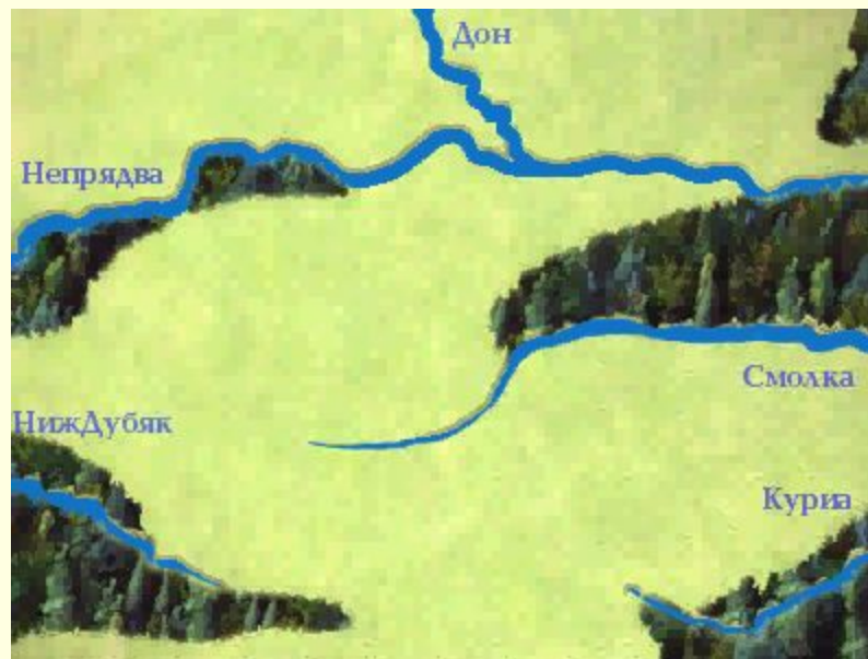
Куликовская битва на карте.