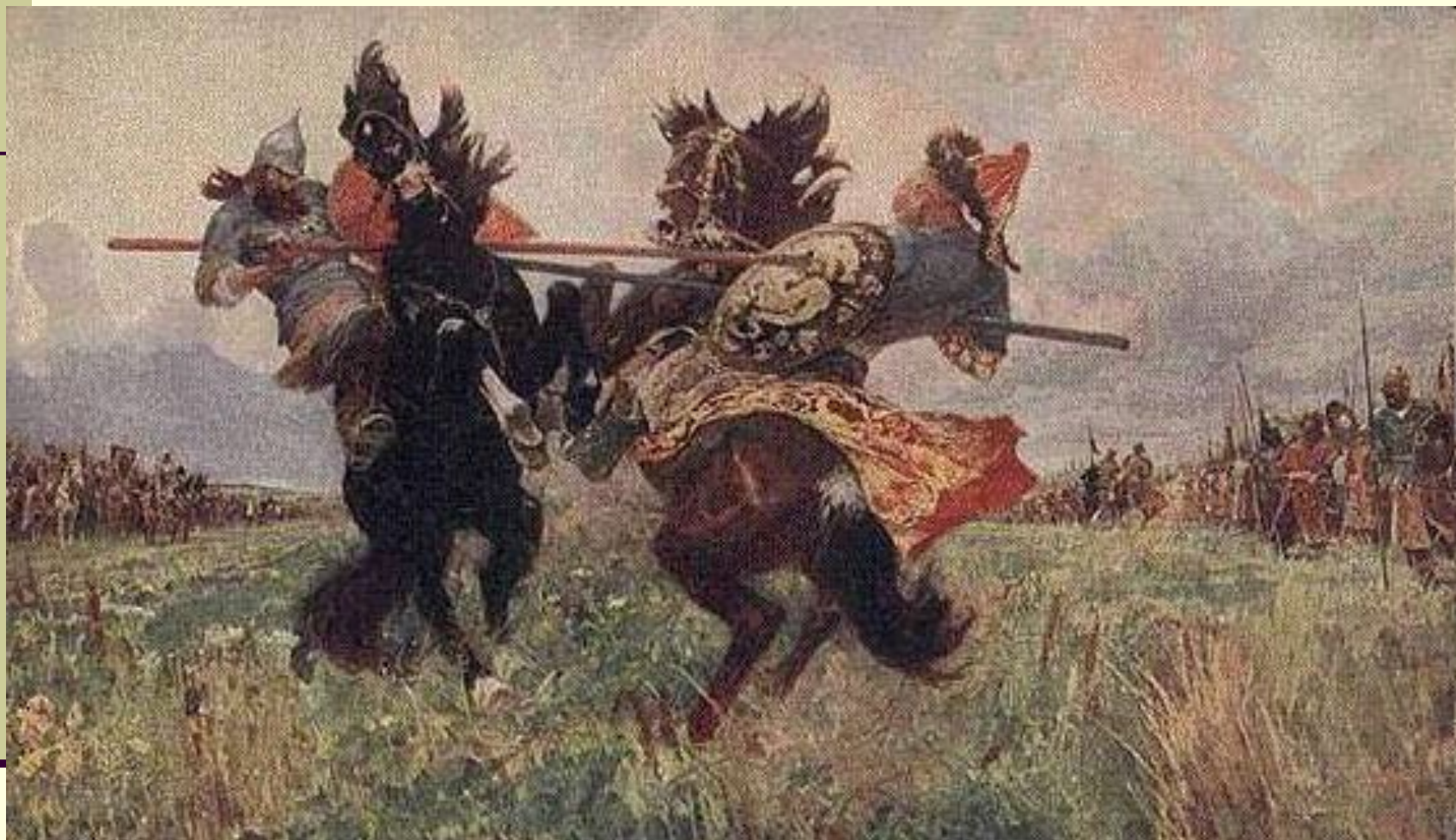
Поединок Пересвета с Челубеем.