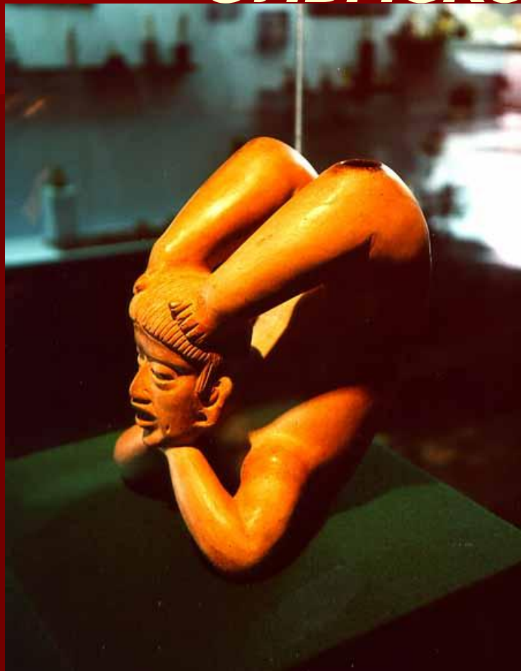
Пустотелая керамическая фигура. Центральная Мексика