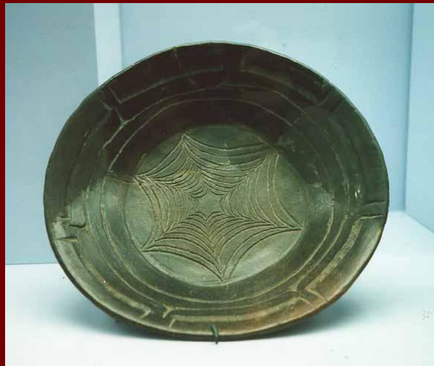
Тарелка из Тлатилько Декорировано линиями по краям и на дне